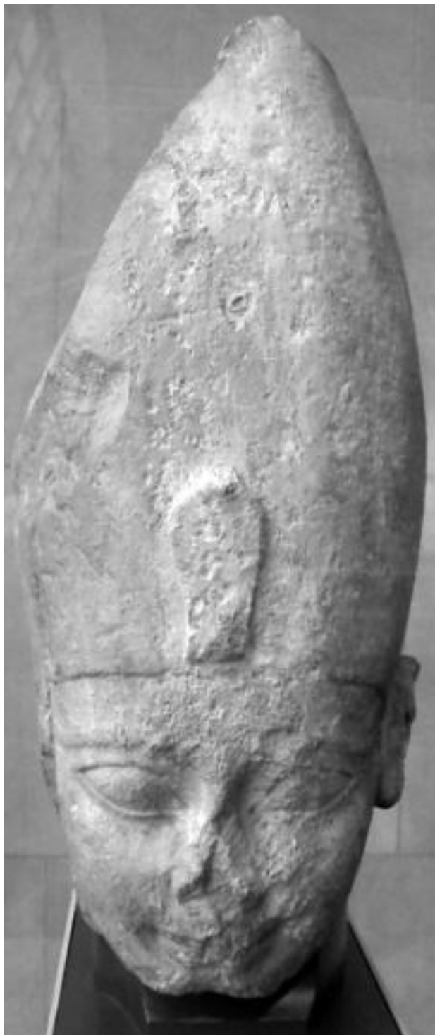
Фараон Яхмес I

Фараон, изменивший лицо древнеегипетской армии и завоевавший Нубию