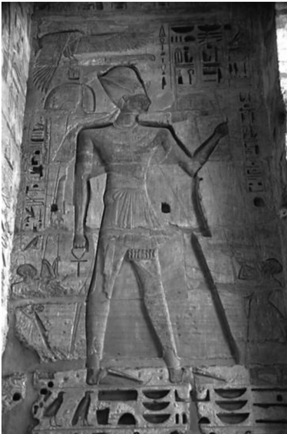
Рельеф в храме Рамзеса III

Последний великий фараон Древнего Египта, защитивший дельту Нила от «народов моря»