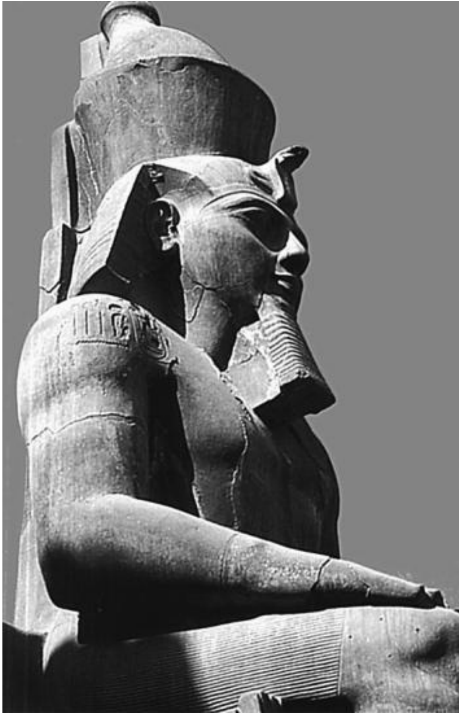
Фараон Рамзес II

Правитель Древнего Египта, выигравший 18-летнюю войну с Хатти у города Кадеша