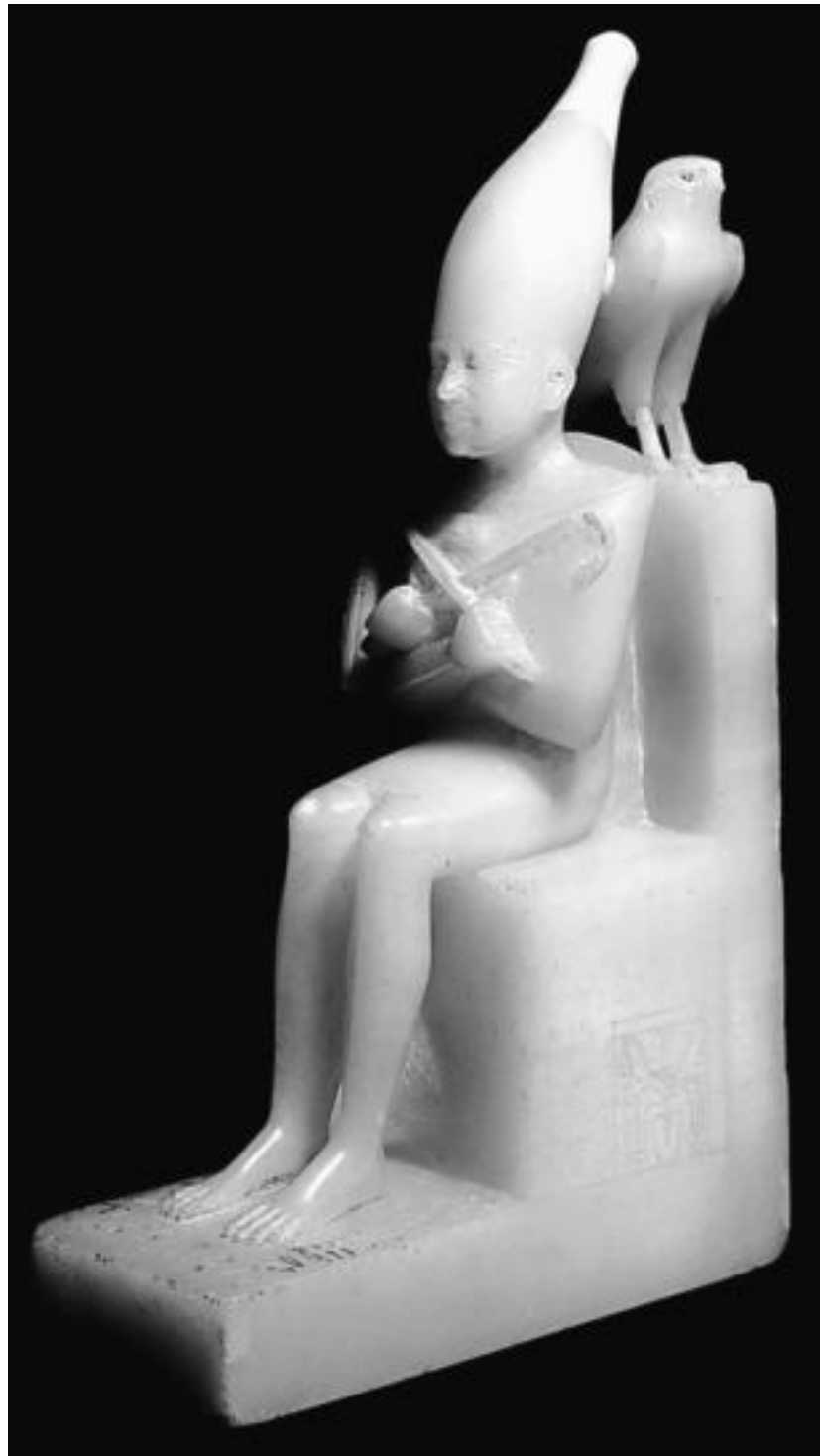
Статуэтка, изображающая Пиопи II

Фараон, подменивший торговлю силой и ставший обладателем меди Синая и золота Нубии