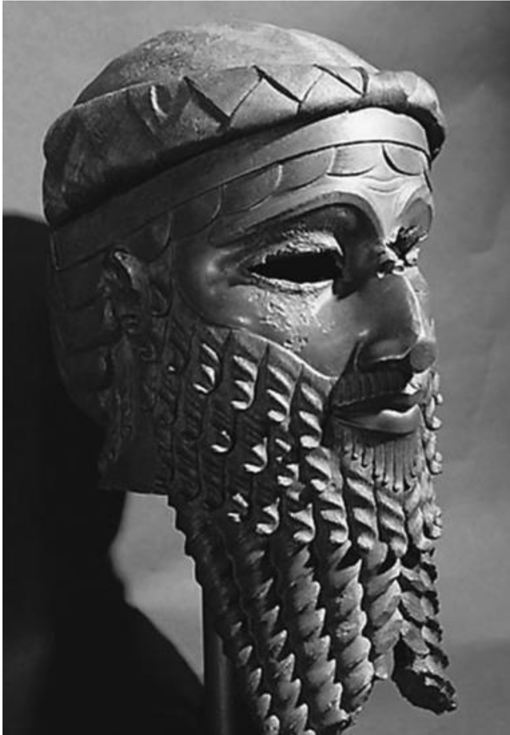
Саргон I Древний

Завоеватель Шумера, Элама, Кедрового Леса и Серебряных Гор