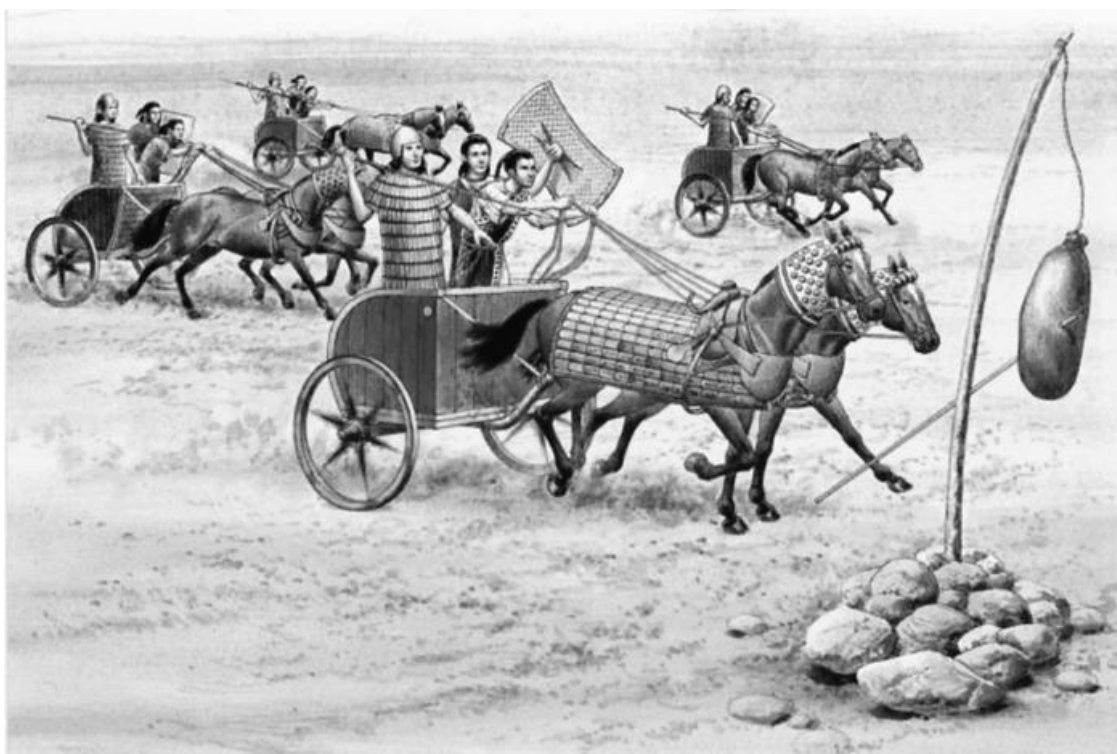
Хеттская боевая колесница

Царь Хатти, уничтоживший Вавилонию и прикрывший границу «Рыхлым кольцом»