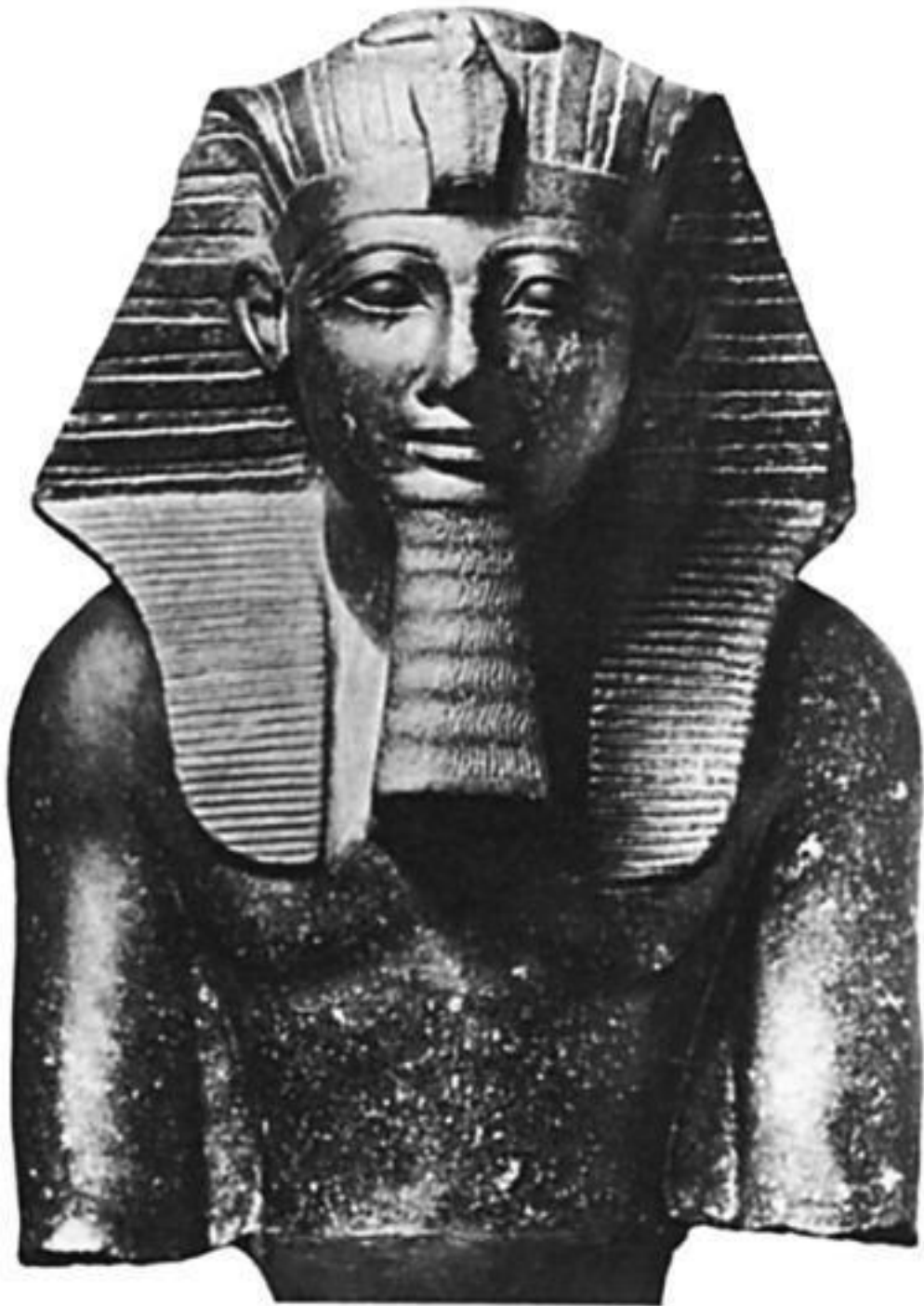
Фараон Тутмос III

Фараон XVIII династии, расширивший Египет до четвертого порога Нила