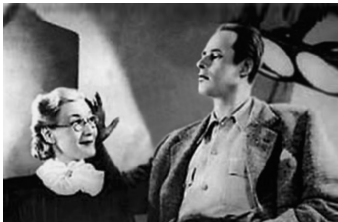
Николай Черкасов и Любовь Орлова в фильме «Весна»

Курьёзность внешнего сходства, похожести двух людей Александров сделал сюжетной интригой кинокомедии «Весна», в которой профессора Никитину и актрису Шатрову блистательно сводит и разводит Любовь Орлова.