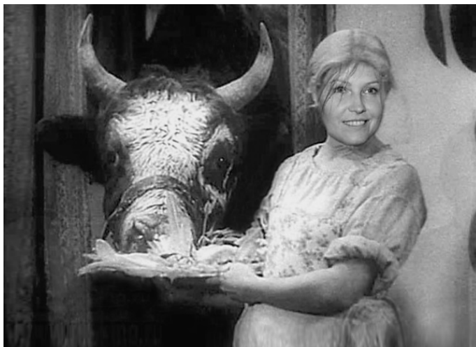
«Лакомка» из фильма «Весёлые ребята»

Эйзенштейн поучает, как сотворить из простодушного питерского работяги политика, вершителя судеб мира: «1. Больше в фуражке. 2. Гораздо сдержаннее, благороднее, но без напыщенности. 3. С меньшей энергично-сдержанной жестикуляцией. 4. Не держать знамя так, как он держит, опустить и менее «плакатно». 5. Без эксцентрики извивающихся старух.