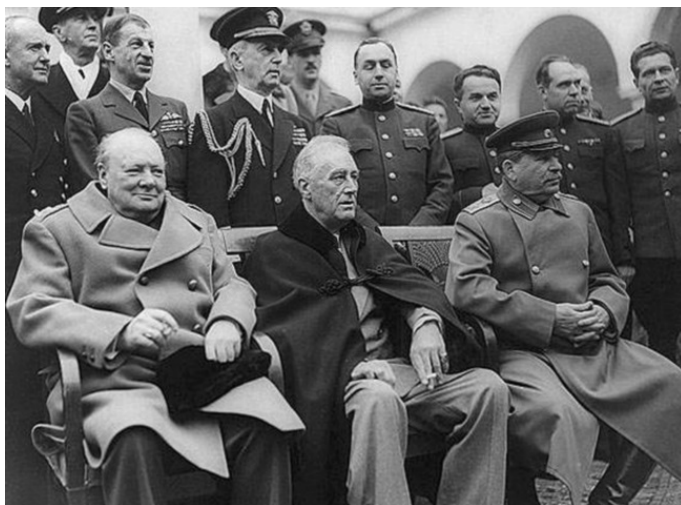
Эпохальные личности: Черчилль, Рузвельт, Сталин в Ялте

Этот совет через секретариат Сталина поступил к кинематографическому руководству, и мы отправились в киноэкспедицию по стране; видели грандиозные новостройки, «Ростсельмаш», создаваемый в степи совхоз «Гигант», многое повидали.