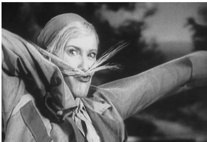
«Лезгинка» из фильма «Волга-Волга»

Куда ни кинь, всюду признаки, намёки на комедийный жанр. С пафосом революции сплошной провал – одни комедийные всплески. Эйзенштейн писал: «Большая ответственность на Петропавловке, ибо выстрела с крыши Зимнего дворца вообще не видно, аврорские и без него плохи...»