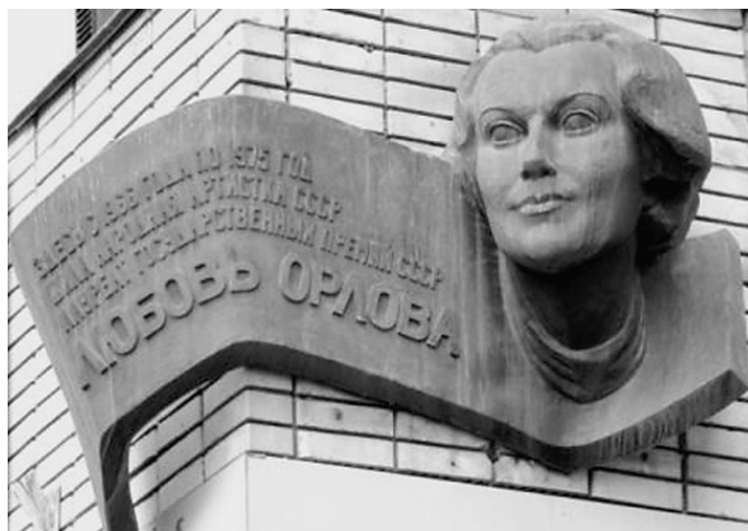
Мемориальная доска под окнами её квартиры на Большой Бронной

Созданная в тесном творческом сотрудничестве с Сергеем Тимофеевичем Конёнковым книга-эпопея «Мой век» имела большой успех. «Политиздат», вполне удовлетворённый авторством Конёнкова при моём ведущем писательском участии в сотворении четырёхсотстраничной саги из устных рассказов легендарного ваятеля, народного сказителя, под стать Бояну эпохи «Слова о полку Игореве», обратился ко мне с просьбой «сделать такую же книгу с лучшим нашим комедиографом Григорием Васильевичем Александровым». Почти два года шла кропотливая писательско-киноведческая работа. Изданная в 1976-м и через год переизданная книга «Эпоха и кино» – её результат.