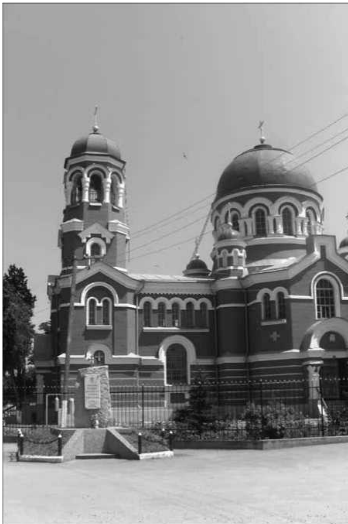
Церковь святого Архистратига Михаила. Быв. станция Пришибская (ныне г. Майский)