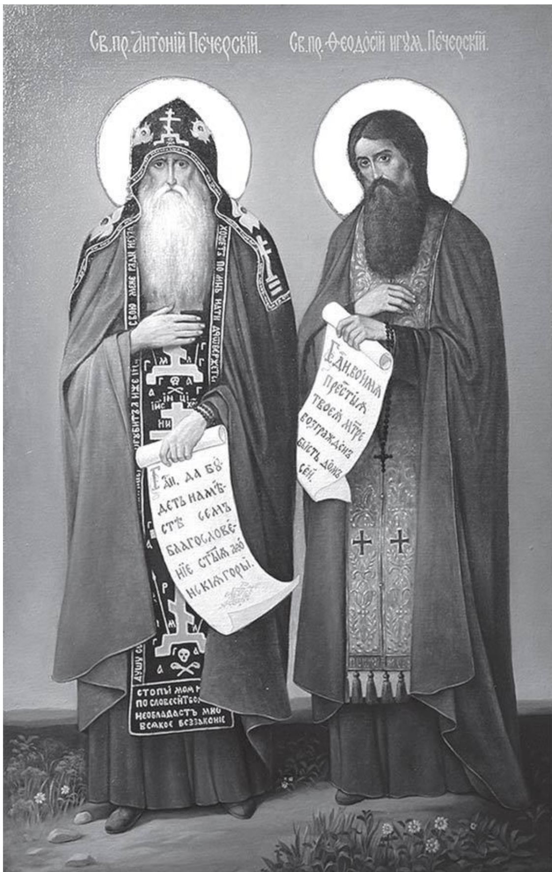
Святые Преподобные Антоний и Феодосии Киево-Печерские