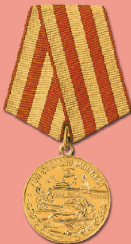
Медаль «За оборону Москвы»