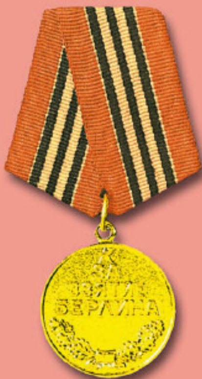
Медаль «За взятие Берлина»