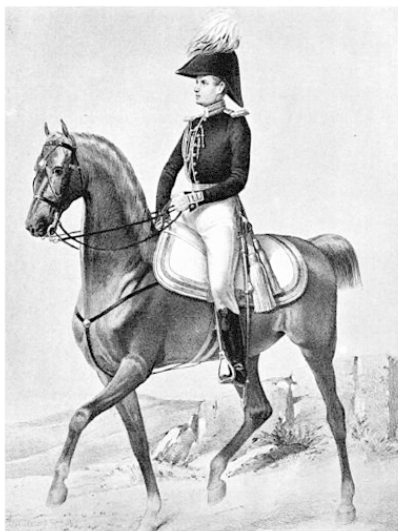
АРМЕЙСКИЙ КАВАЛЕРИЙСКИЙ АДЪЮТАНТ