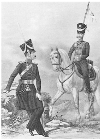
ОБЕР-ОФИЦЕР 2-го и РЯДОВОЙ 1-го Конных полков С.-Петербургского ополчения, 1812—1814

государь голову обнажает. Угадай-ка, кто таков? Ответ смотрите на с. 180.