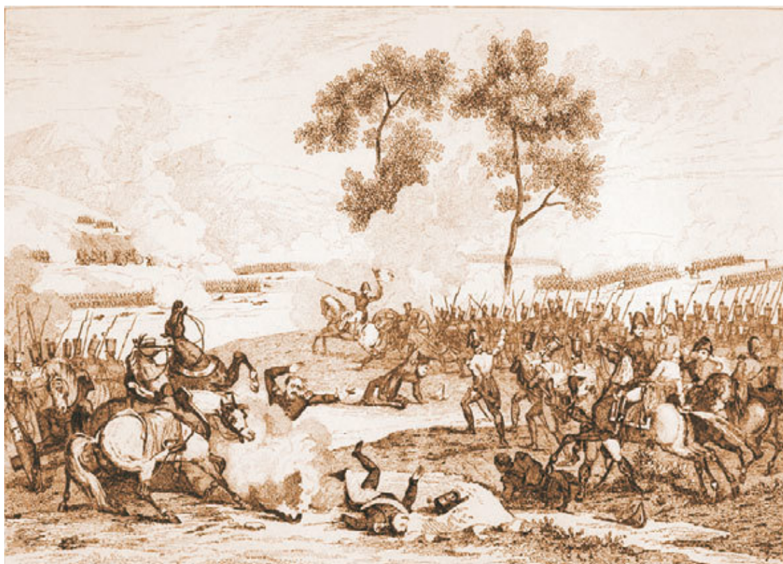
Сражение за Полоцк. Гравюра Мартине, сер. XIX в.