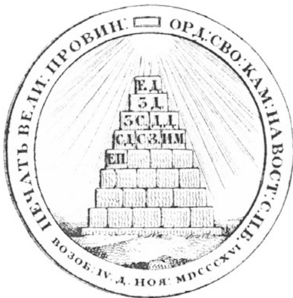
Печать Великой Провинциальной ложи (С.-Петербург), XIX в.