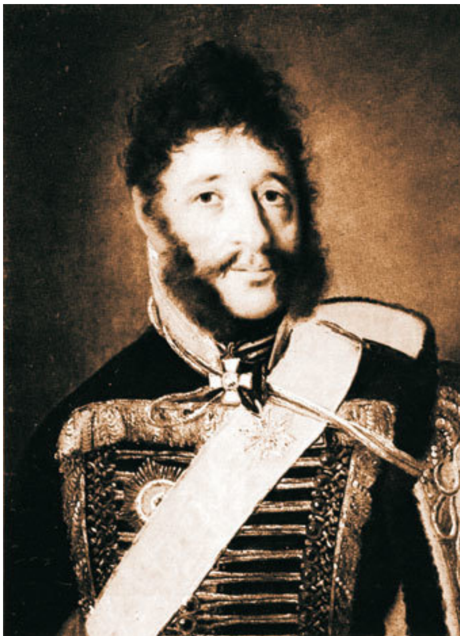
Кульнев Я. П. (1763–1812)