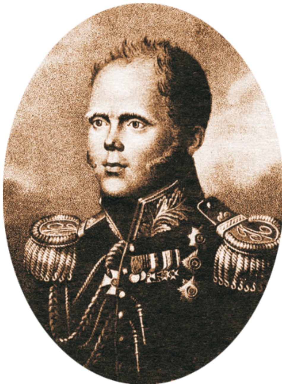
Цесаревич и великий князь Константин Павлович.