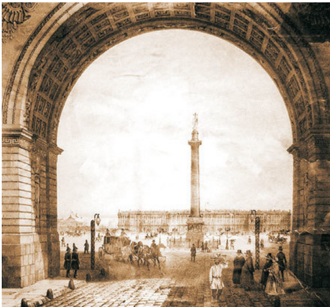
Санкт-Петербург, Дворцовая площадь. Литография Ж. Арну, 1850-е гг.