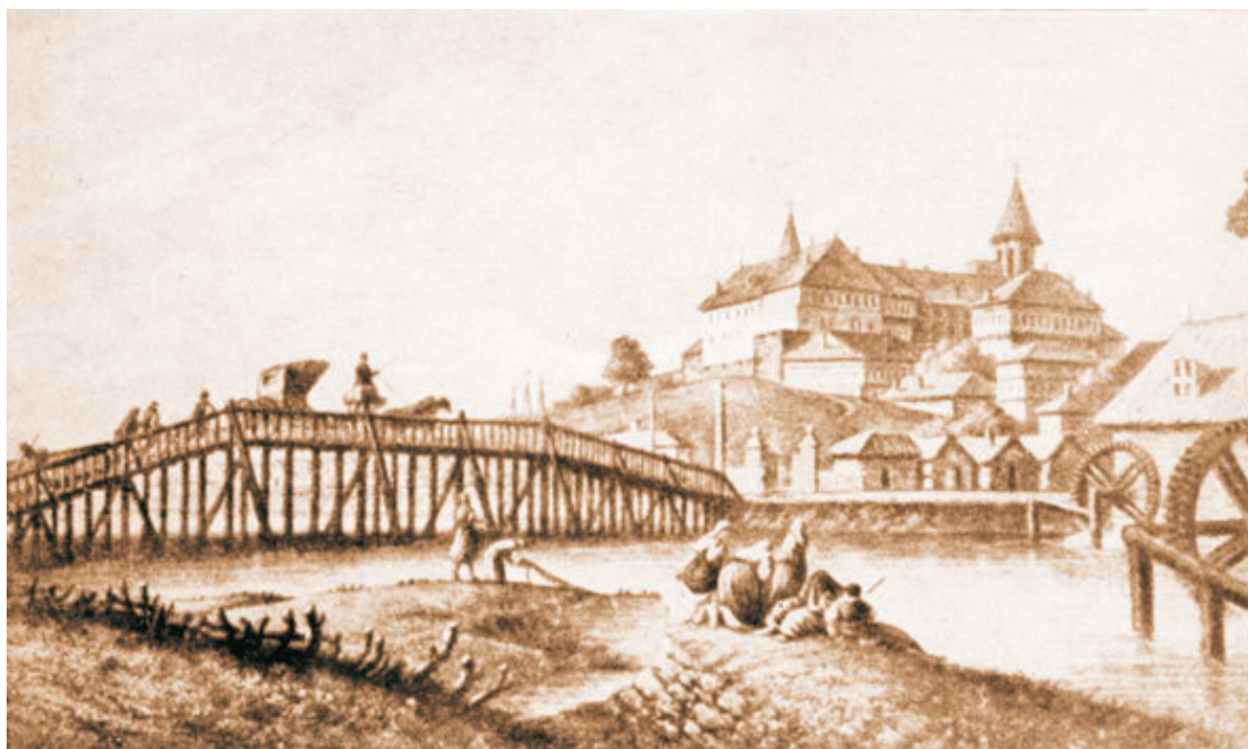
Резиденция господаря на Михай-Водэ в 1794 году (По гравюре Луиджи Майера)