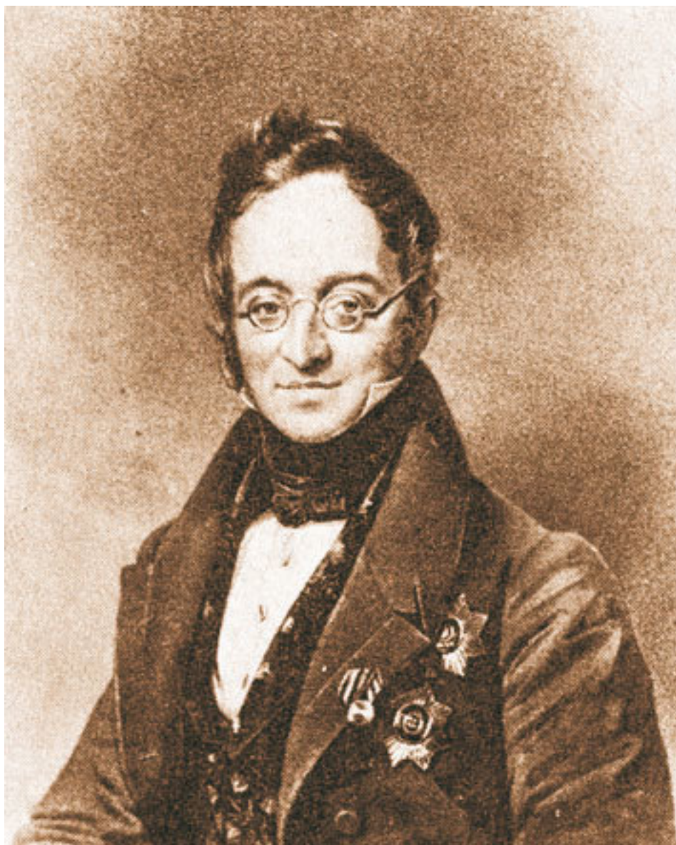
Нессельроде К. В. (1780–1862). Литография Е. Олдермана по оригиналу Ф. Крюгера, 1 пол. XIX в.