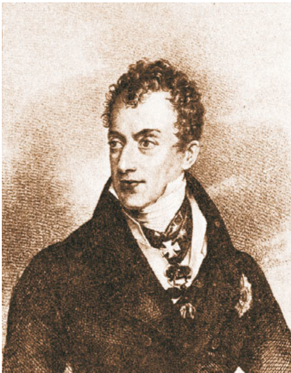
Меттерних К. (1773–1859). Гравюра по оригиналу Ф. Лидера. 1 пол. XIX в.