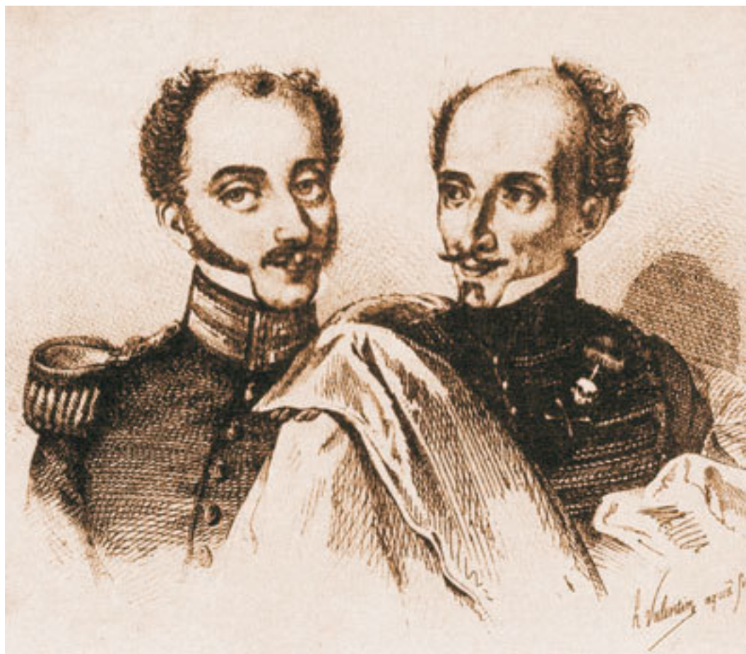
Дмитрий и Александр Ипсиланти.