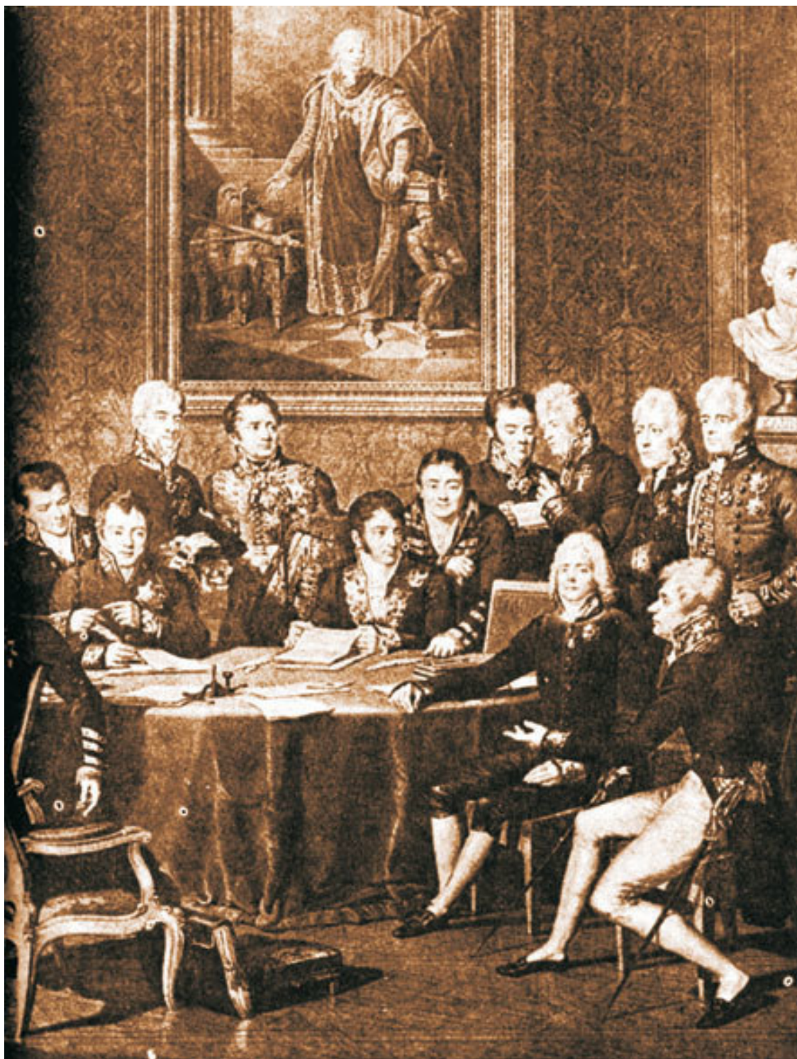
Венский конгресс, 1814–1815 гг. Из русских представителей здесь находились: Александр I, Разумовский А. К., Нессельроде К. В. Правая часть гравюры Ж. Годафруа по оригиналу Ж. Изабе, 1819 г.