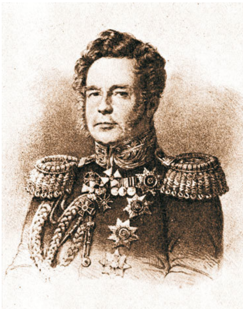
Ридигер Ф. В. (1782–1856)