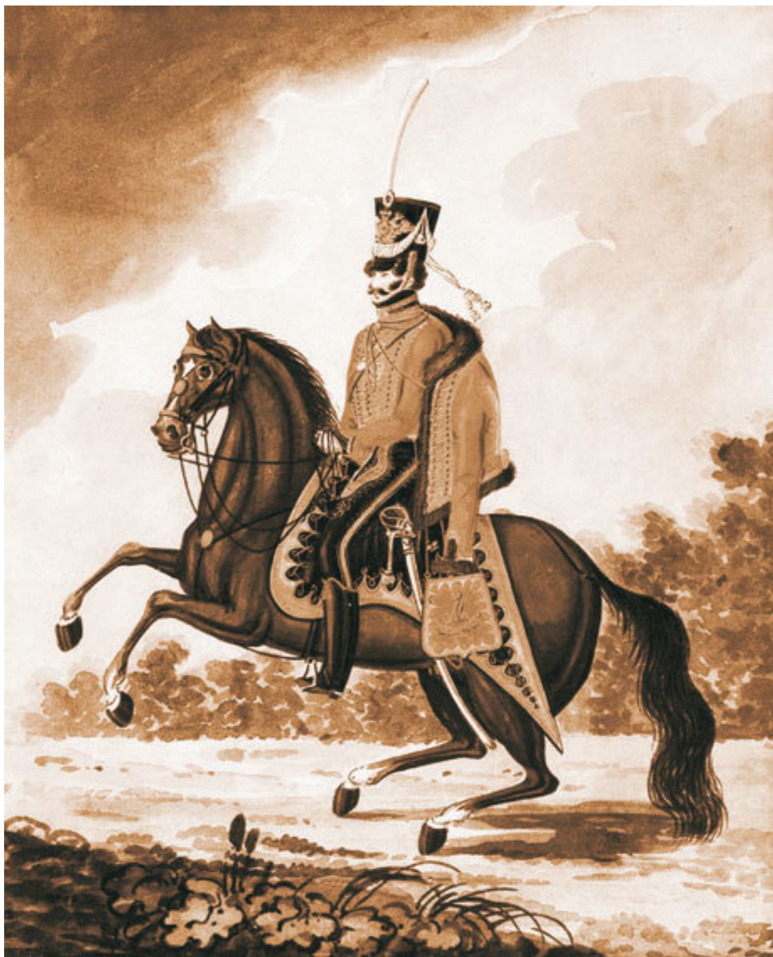
Обер-офицер лейб-гвардии гусарского полка, 1810-е гг. Краузе (конец XVIII – / пол. XIX в.). Бумага, акварель.