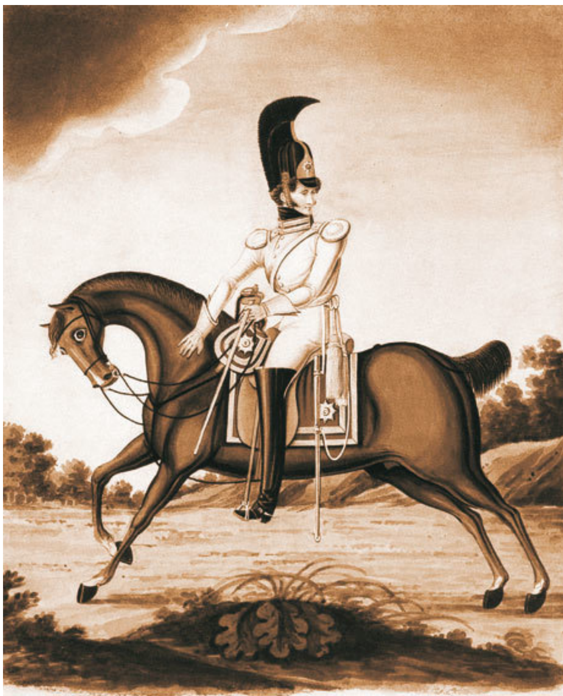
Обер-офицер лейб-гвардии кавалергардского полка, 1810-е гг. Краузе (конец XVIII – / пол. XIX в.). Бумага, акварель.