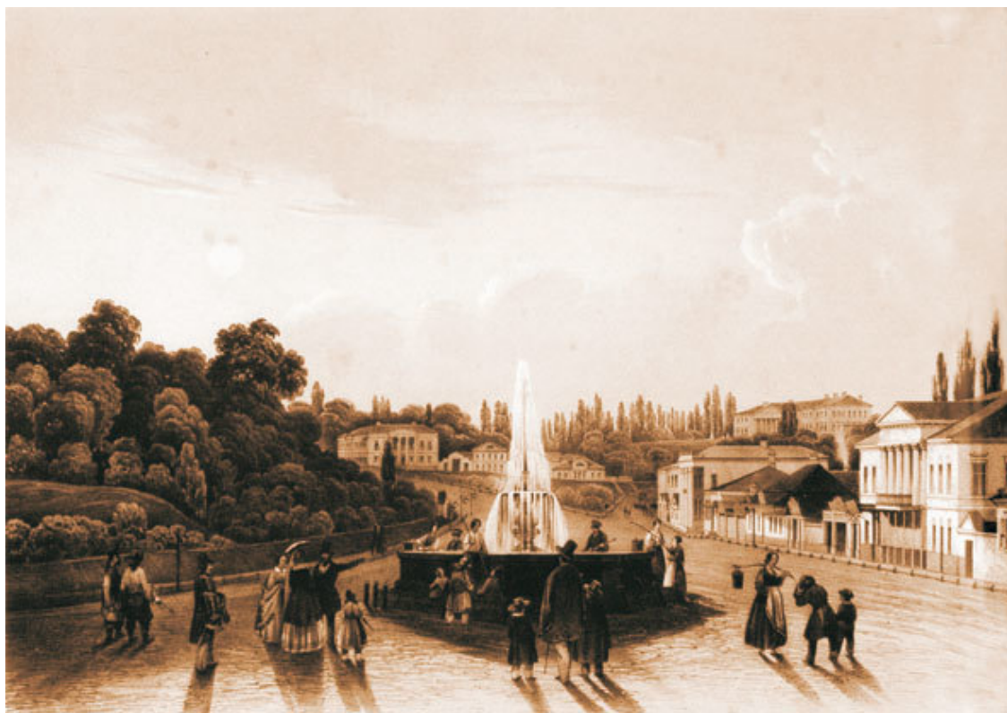
Киев. Театральная площадь (середина XIX века). Литография И. Ляуфера с акварели М. Сажина.