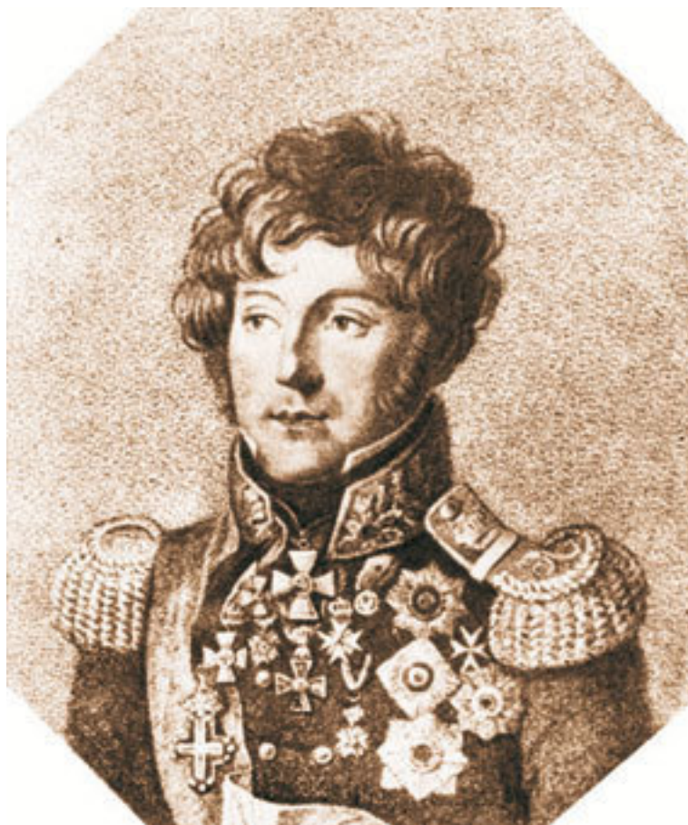
Милорадович М. А. (1771–1825). Гравюра Боллингера с оригинала Тейзингера.