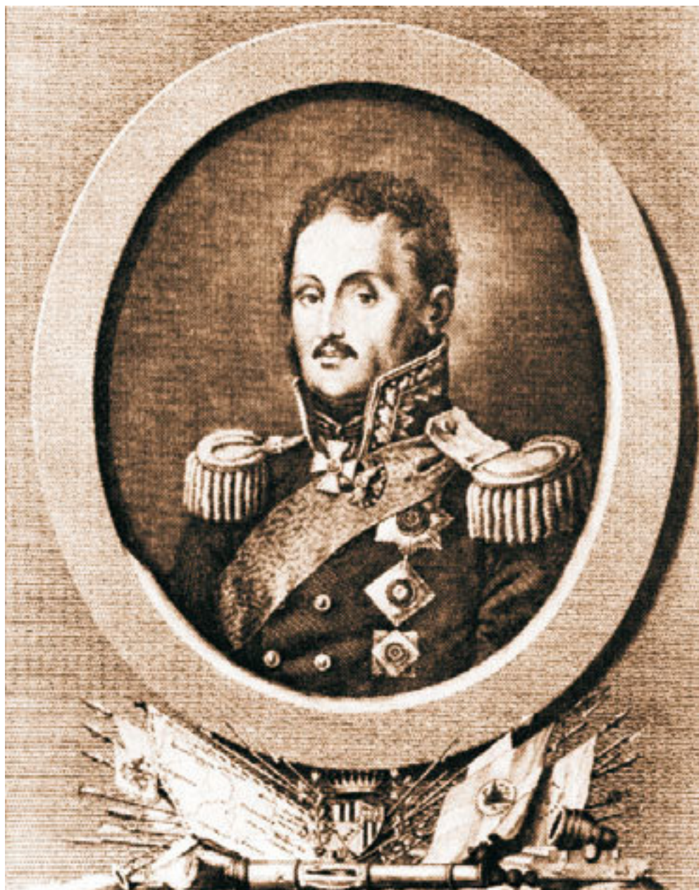
Витгенштейн П. Х. (1768–1842). Гравюра И. Клаубера, 1810-е гг.