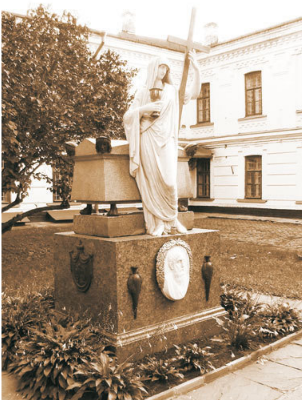
Киев. Могила князя Константина Ипсиланти.