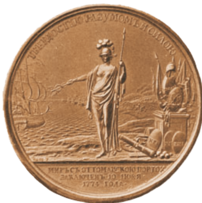
Медаль, выбитая в память Кучук-Кайнарджийского мира 10 июля 1774 г.