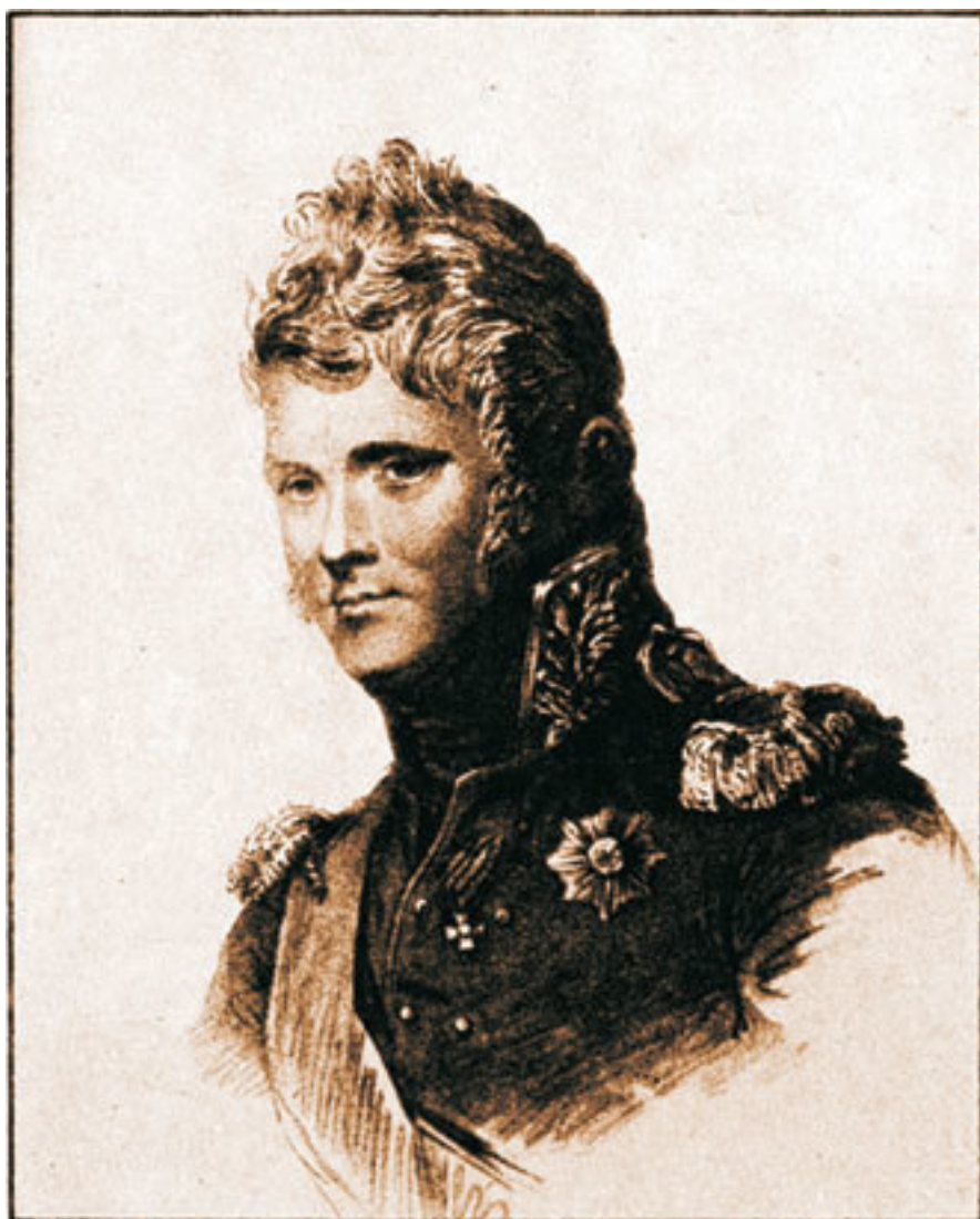
Александр I, император России (1777–1825). Гравюра Ф. Кендрамини по оригиналу Л. Сент-Обена, 1813 г.