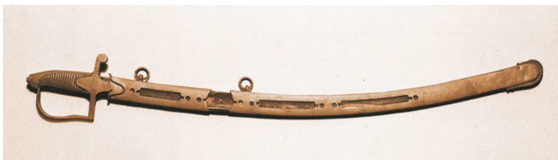
Крест ордена св. Георгия 3-й степени и сабля в ножнах (наградная), принадлежавшие Я. П. Кульневу. Орден был на груди Кульнева в сражении при Клястицах.