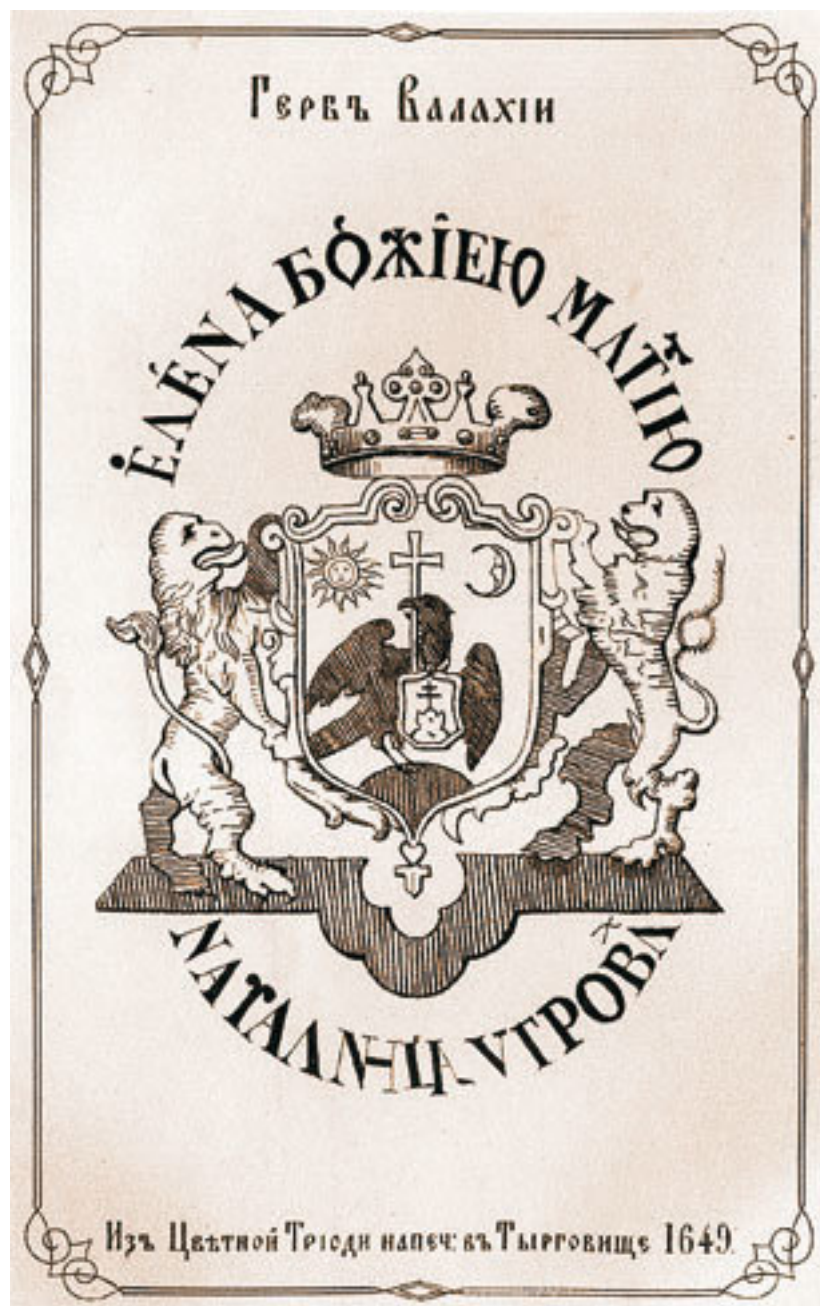
Гербы Молдавии и Валахии.