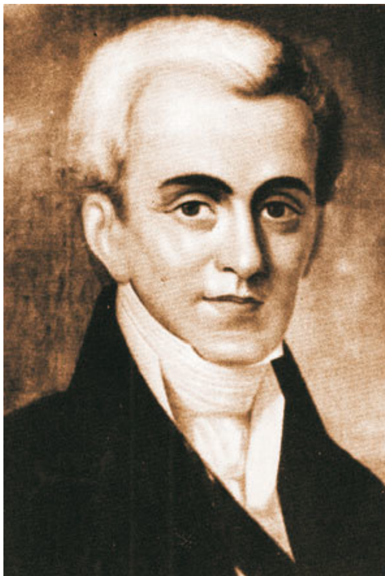
Иоанн Каподистрия (1776–1830), первый президент Греческой республики.