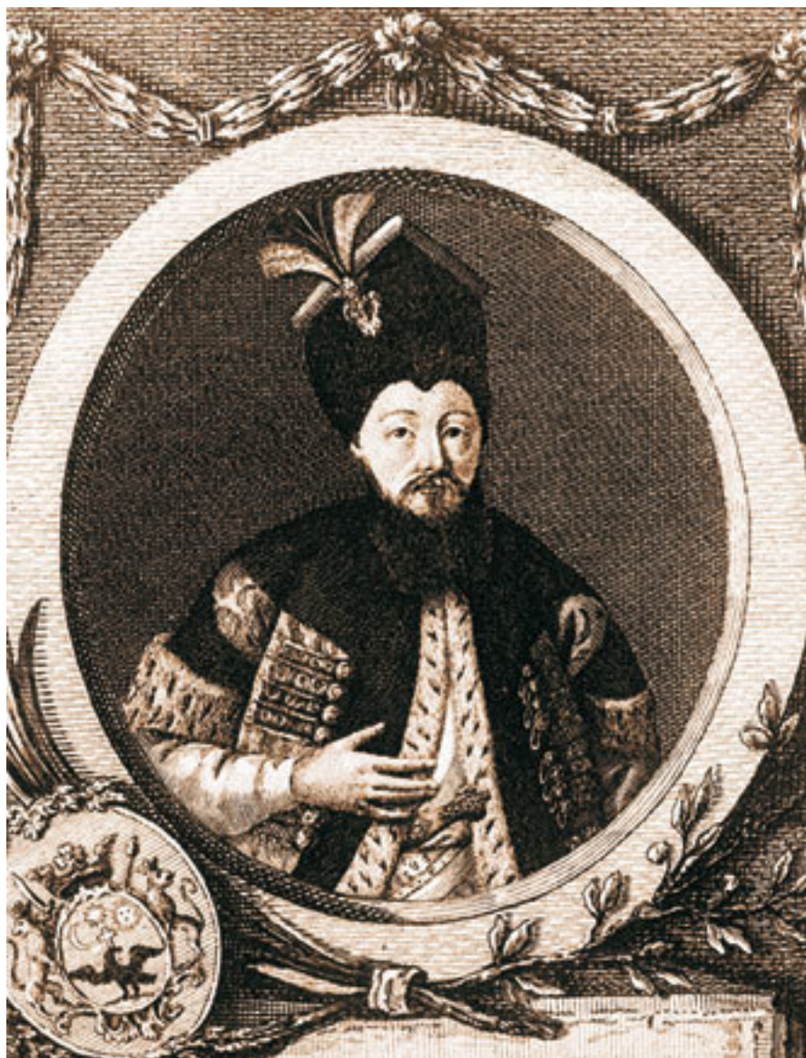
Князь Константин Ипсиланти.