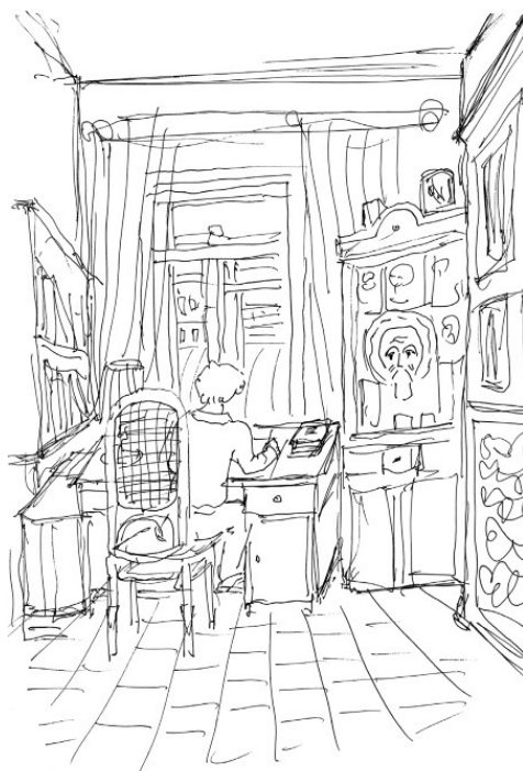
Рисунок на фронтиспие Петра Колосова

© Колосов П.А., текст, иллюстрация, 2015