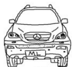
Mercedes ML 2002-2004 г.в. 3,7 AT 4WD 5-7 мест

Вот вам более наглядный пример. За 400 000 рублей сегодня на рынке можно купить Lada Largus 2013—2014 года выпуска и Mercedes-Benz ML примерно 2003 года выпуска. У Мерседеса есть климат-контроль, полный привод, ксеноновые фары, кожаный салон, машина сама по себе больше, к тому же шильдик заставляет соседей завидовать и прочее, и прочее – одни плюсы на первый взгляд. Однако обратимся к цифрам. Транспортный налог на Ларгус обойдется в год от 1044 до 3150 рублей в зависимости от двигателя, а за Мерседес ежегодно придется платить от 7335 до 45080 рублей. Расходы на бензин при прочих равных: 56000 рублей в год у Ларгуса против 86000 у ML.