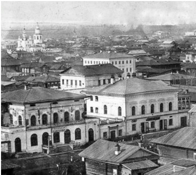
Рис. 2: Енисейск

Слово "Енисейстрой" официально нигде не употреблялось, а только в разговорах. Этот вышеупомянутый трест №1 возник на геологических "осколках" бывших "...строев", причём в той их части, которая занималась поисками и разведкой редкоземельных элементов. В частности, Си-