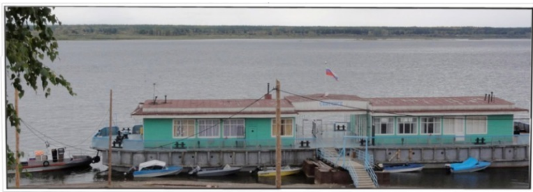
Рис. 4: Пристань Енисейска

рое течение. Когда смотришь на него с берега, то просто завораживает ощущение мощного неудержимого потока. С трудом отрываешь взгляд. Кажется, что это не земное творение, а какой-то космический катаклизм. Даже большие речные суда, проходящие мимо, не вызвали наката волн на берег – это говорило о большой глубине русла. Есть закономерность, что чем меньше глубина, тем больше волны, накатывающиеся на берег от проходящих судов. С нами плыла ещё одна молодая женщина, тоже в эту же партию. Я сразу обратил на неё внимание. Очень стройная, высокая, с русыми волосами, типичная сибирячка с картинок, которые могли сохраниться только в этих медвежьих углах. Очень красивая. Шкипер сказал, что это жена нашего машиниста дизельной электростанции на Кие – так называлось место расположения нашей партии.