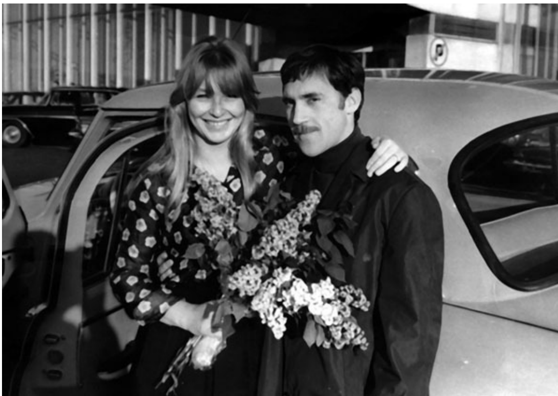
С Мариной Влади в аэропорту Шереметьево. 1969 год

А вообще Марина – женщина умная, очень практичная, очень деловая. У нее же большие связи. Я знаю даже, что она знакома с самим Горбачевым и даже подарила ему свою книгу.