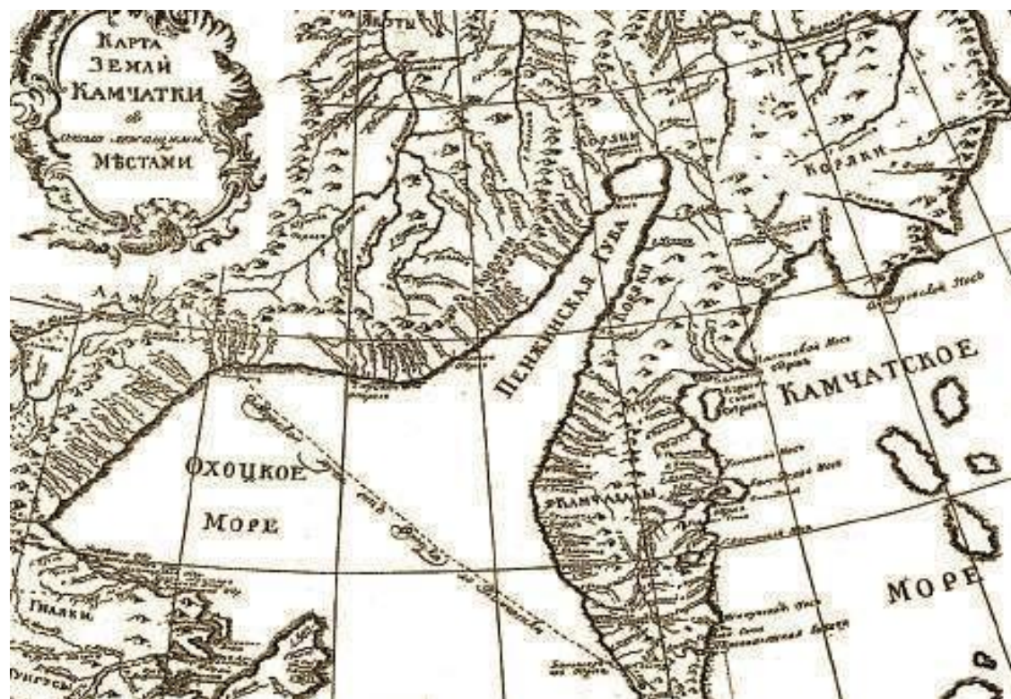
Карта Камчатки Ф. И. Миллера, 1755 год