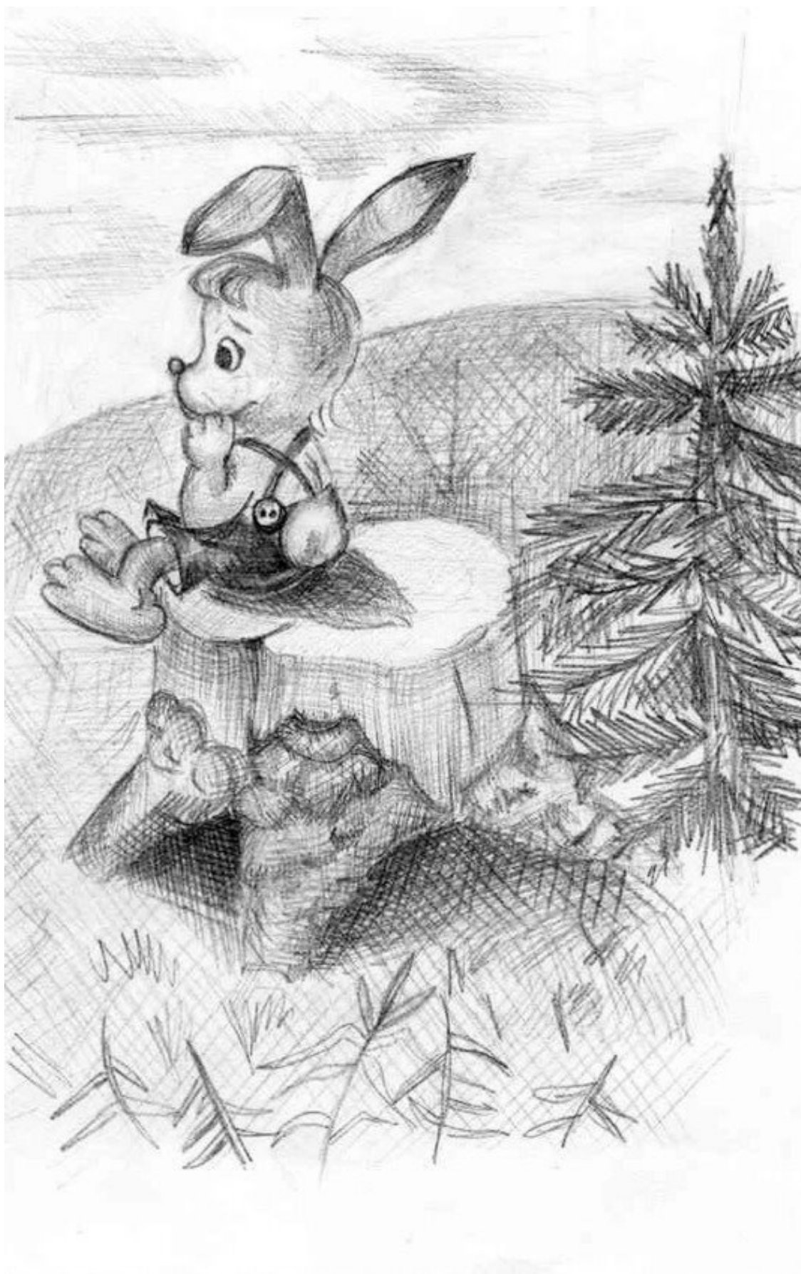
Вдали показывается Комар-гусар