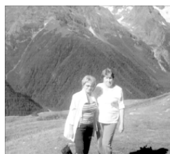
Домбай 2007 г