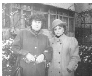
Ташкент 1987 г