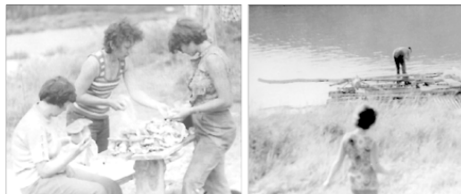
Поход на плотках 1978 г (Алтай)

Я вернусь из будущего в прошлое, Есть родной российский бутерброд.