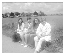
В городе Заандам (Голландия 2008 г)