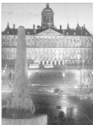
Дворец в Амстердаме ночью

Сейчас королевская семья там не живёт, она предпочитает уютный дворец Бинненхоф в Гааге.