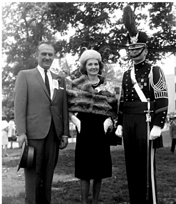
Дональд Трамп со своими родителями Фред и Мэри

Имея такие убедительные преимущества, Фред Трамп зачастую придерживался следующей тактики. Он начинал строительство жилого комплекса, а неподалеку стройку начинали 2-3 конкурента. Фред не только заканчивал строительство раньше остальных на 3-4 месяца, но и по качеству превосходил соседей: само здание было лучше. Просторные комнаты, огромные холлы, комплекс и участок вокруг него выглядели нарядными и чистыми – квартиры легко расходились в аренду. Часто после такой гонки несколько ее участников, так и не успев достроить здание, становятся банкротами, и Фред Трамп с удовольствием скушает их объекты.