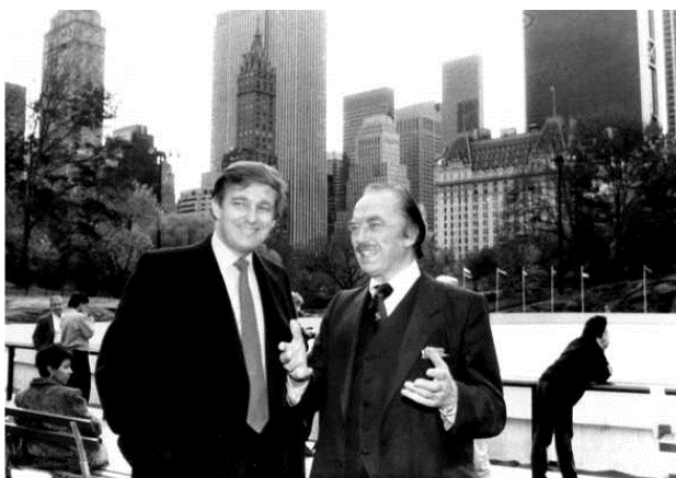
Строительные магнаты. Дональд и Фред Трампы

История семьи Трамп начинается в 1885 году, когда Фредерик Трамп (14.03.1869 – 30.03.1918), дед Дональда, оставив винодельческий бизнес, переехал из Германии в Соединенные Штаты, город Нью-Джерси. В 1905 году родился отец Дональда – Фред Крест Трамп (11.10.1905 – 25.06.1999).