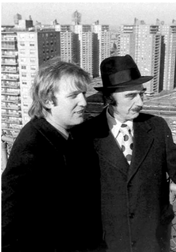
Дональд Трамп со своим отцом Фредом

После окончания учебы Дональд вернулся домой и начал работу с отцом. Продолжая постигать тонкости семейного бизнеса и накапливая опыт, Дональд стал задумываться о начале собственного дела.