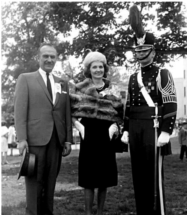
Дональд Трамп со своими родителями Фред и Мэри

вил, подгонял, учил и наказывал. Прекрасно разбираясь во всех этапах строительства в целом и в работе каждого строителя в частности, он мог объяснить нерадивому или неумелому рабочему, если видел такого, как правильно выполнить задание.