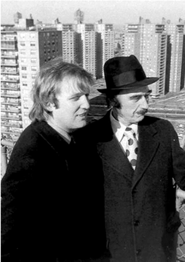
Дональд Трамп со своим отцом Фредом