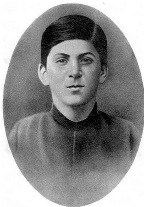
И. В. СТАЛИН. Фото 1894 г.