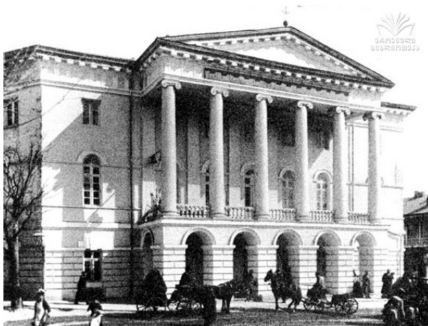
Рис. 34. Тифлисская духовная семинария

Первые 5 русские переводы сталинских стихов связаны с некоторыми засекреченными обстоятельствами. Завеса тайны частично приоткрылась после выхода в свет статьи [Кот] Льва Котюкова в 2002 году, но все детали этой истории восстановить не удалось. Из рассказов очевидцев известно, что в 1949 году, к 70-летию Сталина, но втайне от него, Лаврентий Берия задумал издать сборник стихотворений юбиляра в русских переводах, в подарочном оформлении, многотысячным тиражом. Для этой цели к работе были привлечены такие замечательные поэты, как Арсений Тарковский, Павел Антокольский, Александр Ойслендер, возможно, и другие. Некоторые авторы пишут, что среди них был и Борис Пастернак. О количестве стихов можно судить по свидетельству А. Тарковского о том, что только ему одному было передано для перевода 22 стихотворения [Ку]. «Но в самый разгар работы над переводами был получен грозный приказ: срочно прекратить сию деятельность» [Кот]. Очевидно, что этот приказ последовал от кого-то более влиятельного, чем Л. Берия. Ясно, что им был Сталин. Несмотря на то, что работа не была завершена 6