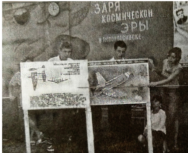
проведение Часа памяти