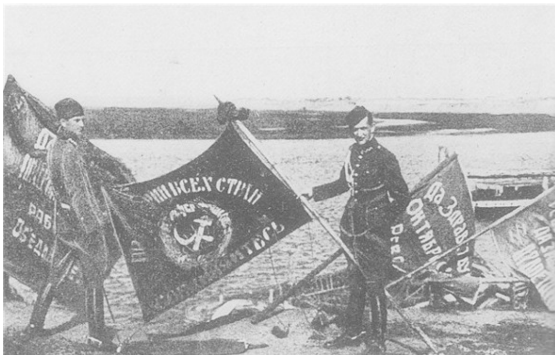
Знамена частей РККА, захваченные польскими войсками

Однако РККА, понеся большие потери на Висле, нуждалась в пополнении, в первую очередь людскими ресурсами. В этой связи 19 августа на заседании Политбюро ЦК РКП (б) было принято решение «принять усиленные меры к общей мобилизации белорусов» и, после окончания заседания, В. И. Ленин направил И. Т. Смилге телеграмму: «Необходимо налечь изо всех сил, чтобы белорусские рабочие и крестьяне, хотя бы в лаптях и купальных костюмах, но с немедленной и революционной быстротой дали Вам пополнение в тройном и четверном количестве». 26