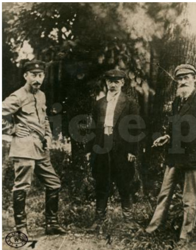
Члены Временного польского революционного комитета (слева направо): Феликс Дзержинский, Юлиан Мархлевский и Феликс Кон. 10 августа 1920 г.

коммунисты – члены ЦК РКП (б): Юлиан Мархлевский (председатель), Эдвард Прухняк (секретарь), Феликс Дзержинский, Феликс Кон и Юзеф Уншлихт. С целью образования Советской Социалистической Республики Польши, Польревком должен был принять на себя всю полноту власти после взятия Варшавы и свержении Пилсудского.