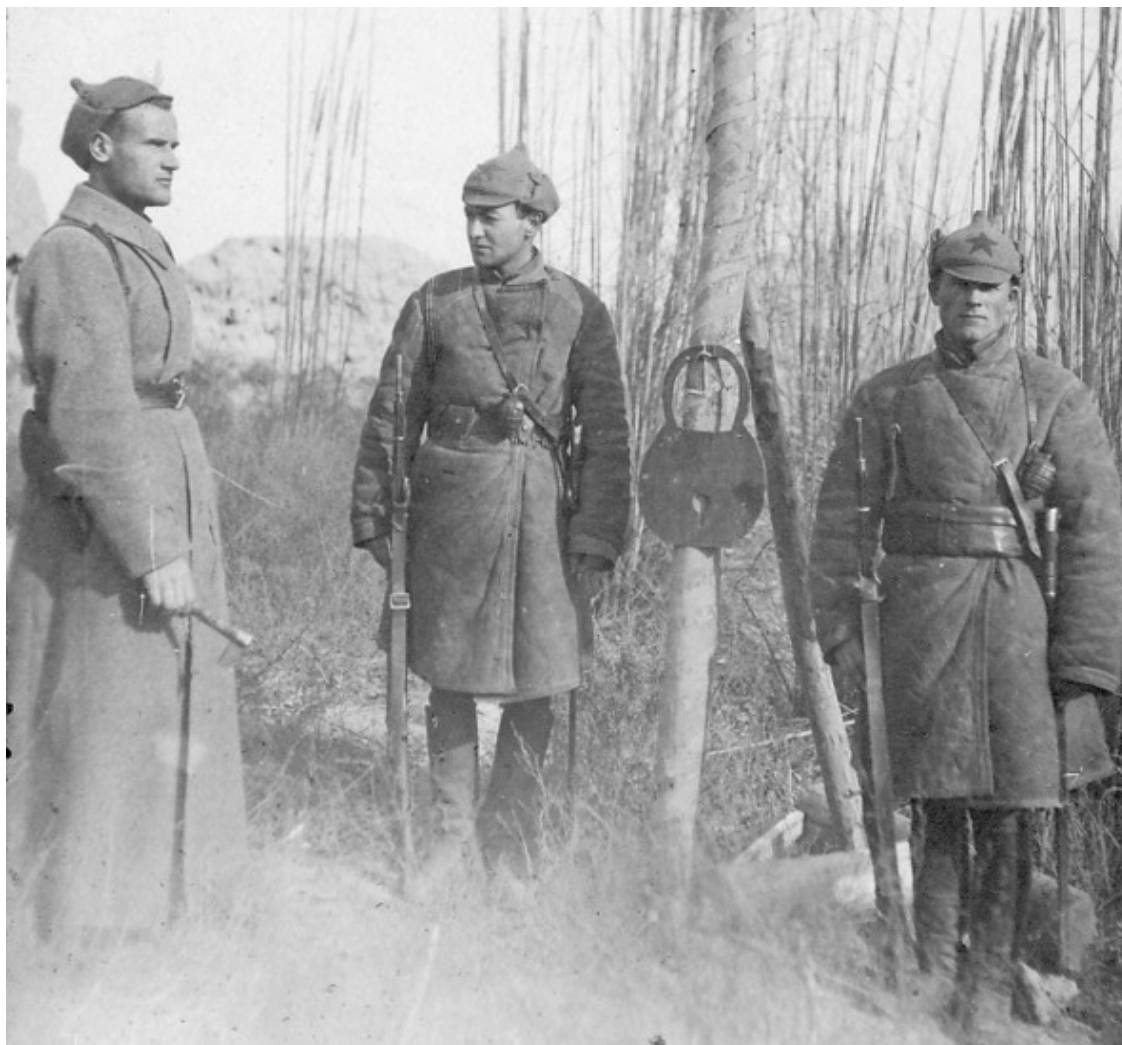
«Граница на замке!»

Зимние холода выгоняют бандитов из лесов и заставляют их бросать оружие. В дальнейшем, с укреплением советских органов в Белоруссии, бандитизм вскоре потеряет свою остроту». 77