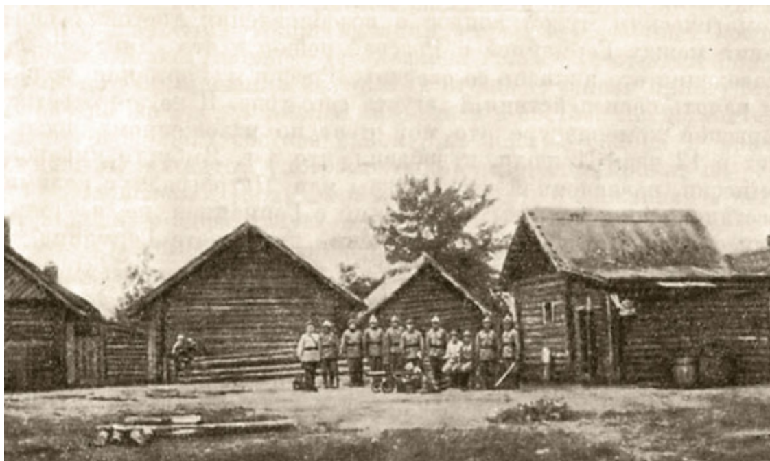
Пограничники у заставы