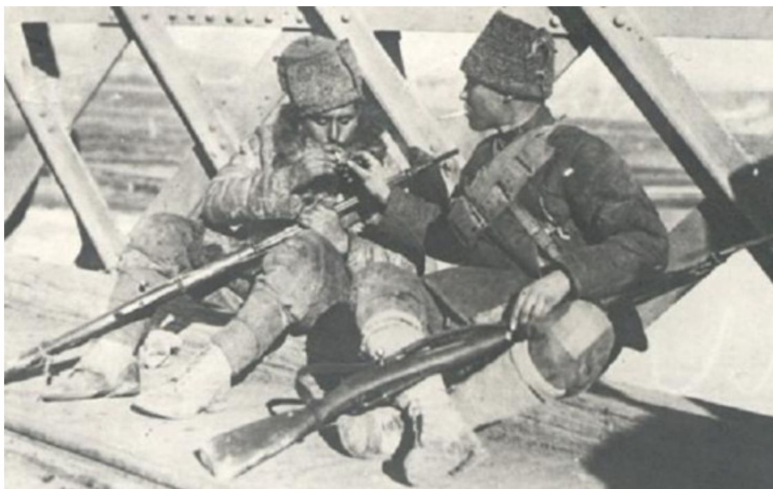
«Форма восемь – что есть, то носим»

Сложной была и обстановка на границе. Разведки сопредельных стран все больше усиливали свою деятельность против советских республик. В пограничной полосе активизировались белогвардейские и националистические формирования, а также различные бандгруппы. Об этом, в частности, свидетельствует «Доклад секретного отдела ВЧК о повстанческом движении по состоянию на ноябрь 1920 г.» от 11 декабря 1920 г.: