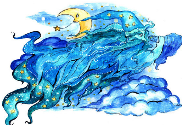
Ночной ветер Эль-Экрос

Ночной ветер Эль-Экрос никогда не дожидался, пока Солнце окончательно закатится за горизонт, и принимался за свои дела задолго до того, как заснут дневные ветерки. А дел у него было невпроворот. Сначала требовалось осмотреть мантию, которая у Эль-Экроса была целиком из звезд, и отряхнуть ее от космической пыли. Потом следовало убедиться, что ты не забыл надеть звездный колпак (ибо без колпака подданные тебя ни во что не ставили). После этого Эль-Экрос проверял, нет ли у Короля-Ветра планов на ночь. Каким бы великим ни считался король, он был обязан вовремя ложиться спать и не ворошить прошлое под покровом ночи. Для наблюдения за ветерками и королем у Эль-Экроса имелась специальная подзорная труба. Ее корпус состоял из свернутого в трубочку и очень послушного ночного облака, а линзы представляли собой не что иное, как сплюснутые, дрожащие капли воды.