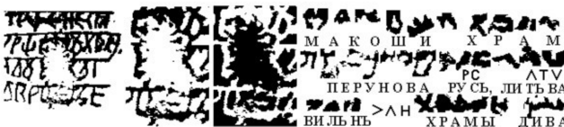
Рис.3. Экслибрис храма Макоши в Вильно и его чтение

Опять-таки, если это был фальсификатор XVIII – XIX веков, который знал, что древние летописи уцелели прежде всего в Новгороде (кстати сказать, все нынешние исследователи полагают, что Велесова книга создана жрецами из Новгорода), то он, сочиняя штамп храма, поставил бы там в качестве места хранения Новгород, а не Владимир. Возможному фальсификатору вполне достаточно было изготовить один экслибрис . Между тем В. А. Чудинов обнаружил на той же дощечке и второй .