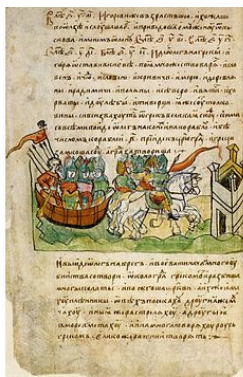
Рис.1. Вид одной из страниц «Повести»

Академик Б. А. Рыбаков (1908—2001) утверждал, что самые интересные страницы «Повести Временных Лет» были изъяты и заменены . В частности, речь шла о подмене подлинных листов на тексты о призвании варягов.