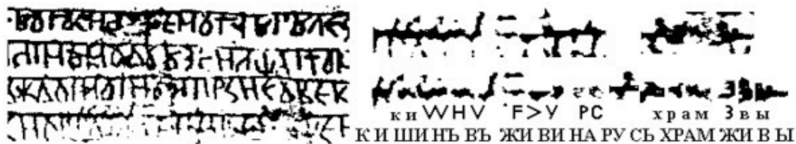
Рис.4. Эксилибрис храма Живы в Кишиневе и его чтение

что был написан над строкой – это правая часть самой нижней, десятой строчки. Ещё одним местом хранения дощечек был храм Живы.