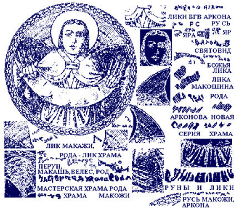
Рис.8. Антропоморфный лик Яра

Надписи на голове персонажа образуют слово РУСЬ , тогда как глаза – слова ЯРА и ЯР . Тень на левой щеке представляет собой столбец букв, читаемых как слово СВЯТОВИД . Тем самым, мы получаем очень важное свидетельство того, что перед нами не просто РУСЬ ЯРА , но сам Яр воплощен в образе Святовида.