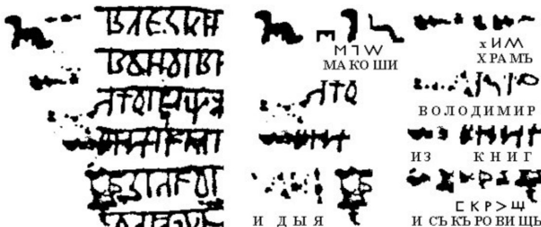
Рис.2. Экслибрис храма Макоши во Владимире на дощечке №16А и его чтение