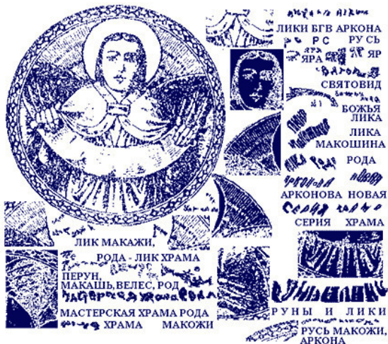
Рис.8. Антропоморфный лик Яра

В основе славянского пантеона находятся боги Макошь, Род, Перун, Велес и Жива, туда не входит Яр – сын Велеса. Однако Яр все-таки упоминается в ряде текстов.