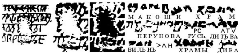
Рис.3. Экслибрис храма Макоши в Вильно и его чтение

тели полагают, что Велесова книга создана жрецами из Новгорода), то он, сочиняя штамп храма, поставил бы там в качестве места хранения Новгород, а не Владимир. Возможному фальсификатору вполне достаточно было изготовить один экслибрис . Между тем В. А. Чудинов обнаружил на той же дощечке и второй .