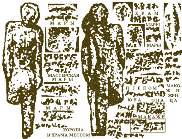
Рис.6. Чтение надписей на виде сзади