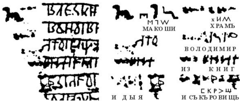
Рис.2. Экслибрис храма Макоши во Владимире на дощечке №16А и его чтение