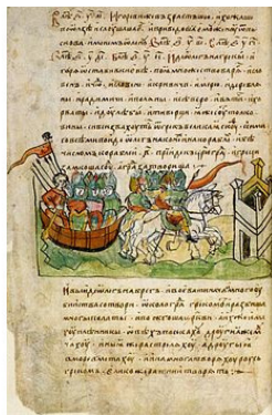
Рис.1. Вид одной из страниц «Повести»

Академик Б. А. Рыбаков (1908—2001) утверждал, что самые интересные страницы «Повести Временных Лет» были изъяты и заменены . В частности, речь шла о подмене подлинных листов на тексты о призвании варягов.