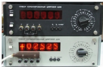
Рис. 2. Ампервольтметр – АВО

АВР автоматическое включение резерва (резервного питания)