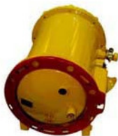
Рис. 5. Аппарат защиты от токов утечки, унифицированный рудничный – АЗУР

АЗУР аппарат защиты от токов утечки, унифицированный рудничный