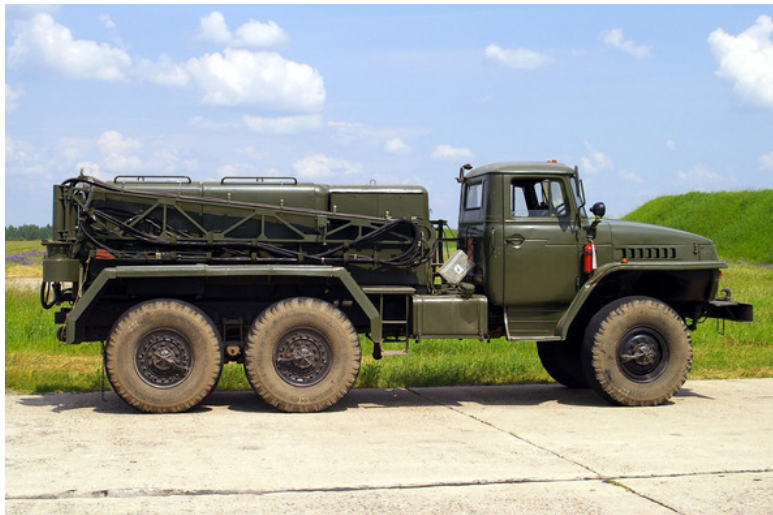
Рис. 8. Агрегат питания, аэродромный – АПА

АПВ 1.автоматическое повторное включение. 2.провод с алюминиевой жилой и поливинилхлоридной изоляцией (маркировка)