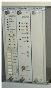
Рис. 4. Аппаратура дальней автоматической связи энергосистем – АДАСЭ

АДАСЭ аппаратура дальней автоматической связи энергосистем