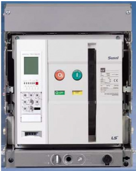
Рис. 1. Автоматический воздушный выключатель – АBB

АВВГ кабель с алюминиевыми жилами с изоляцией из поливинилхлорида в оболочке из поливинилхлорида, не имеющий внешней защиты – «голый» (маркировка)