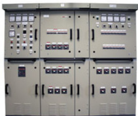
Рис. 9. Аварийный распределительный щит – АРЩ

АС 1.автоматическая синхронизация. 2.алюминиево-стальной голый провод (в маркировке). 3.антрацит семечко (в маркировке каменного угля). 4.атомная станция