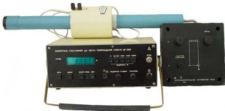
Рис. 6. Аппарат для испытания изоляции – АИИ

АИИС ТУЭ автоматизированная информационно-измерительная система технического учета электроэнергии