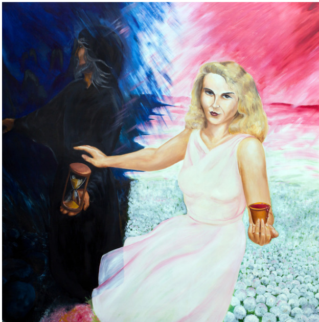
«День и Ночь»