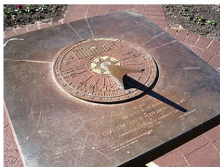
Илл. 5. Горизонтальные солнечные часы в городе Перт, Австралия

Примечание: любопытной особенностью солнечных часов в Южном полушарии является то, что тень в полдень – на юге, а Солнце – на севере; видимый путь Солнца по небосводу проходит справа налево, поэтому нумерация часов идёт против часовой стрелки (Илл. 5.).