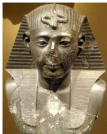
Илл 1. Голова статуи Сети I.

Первые документально подтвержденные упоминания о солнечных часах – надпись в гробнице фараона Сети I (Илл. 1 и 2). Она была сделана в 1306—1290 г.г. до н. э. Там говорится о солнечных часах, измеряющих время по отбрасываемой тени. К сожалению, сами солнечные часы не были найдены.