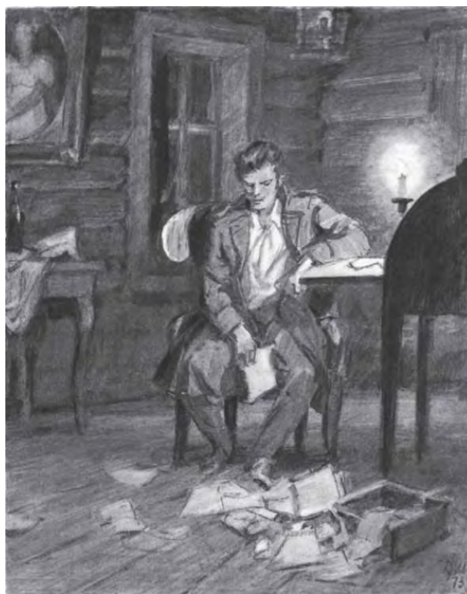
Владимир отпер комоды и ящики, занялся разбором бумаг покойного.

Владимир отпер комоды и ящики, занялся разбором бумаг покойного. Они большею частию состояли из хозяйственных счетов и переписки по разным делам. Владимир разорвал их, не читая. Между ими попался ему пакет с надписью: письма моей жены . С сильным движением чувства Владимир принялся за них: они писаны были во время Турецкого похода* и были адресованы в армию из Кистеневки. Она описывала ему свою пустынную жизнь, хозяйственные занятия, с нежностью сетовала на разлуку и призывала его домой, в объятия доброй подруги; в одном из них она изъявляла ему свое беспокойство насчет здоровья маленького Владимира; в другом она радовалась его ранним способностям и предвидела для него счастливую и блестящую будущность. Владимир зачитался и позабыл всё на свете, погрузись душою в мир семейственного счастья, и не заметил, как прошло время, стенные часы пробили одиннадцать. Владимир положил письма в карман, взял свечу и вышел из кабинета. В зале приказные спали на полу.