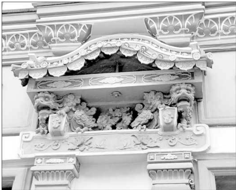
Чайный дом Перлова. Фрагмент. Современная фотография