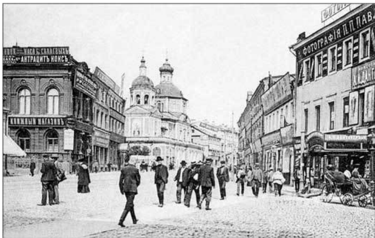
Мясницкая улица. Фотография начала XX века