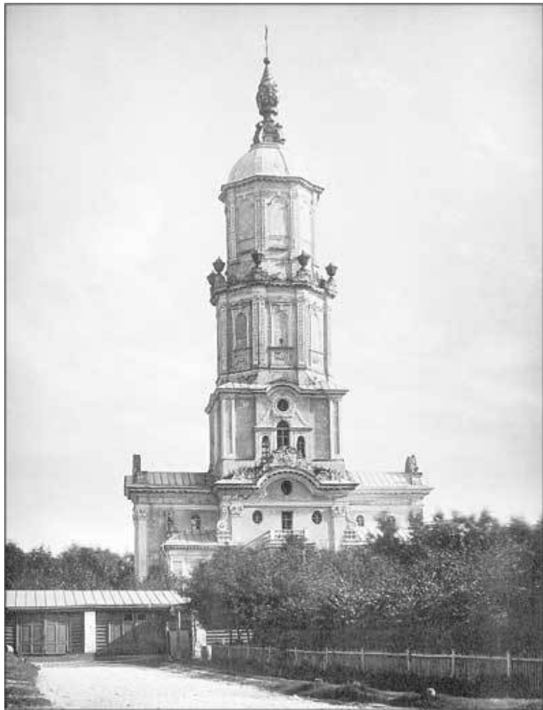
Церковь Архангела Гавриила. Фотография из альбома