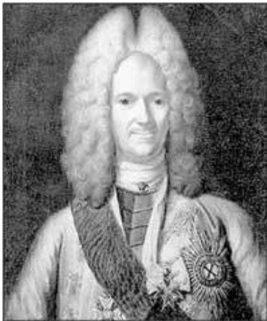
Неизвестный художник. Портрет Александра Даниловича Меншикова

шей слободе». За 1639 год значилась «церковь каменная Гавриила Архангела «на Поганом пруде». Такое название местности продолжалось и за последующие годы. Пруд, как гласит предание, прослыл поганым оттого, что вблизи находились бойни, из которых стекала в него нечистота» 4 .