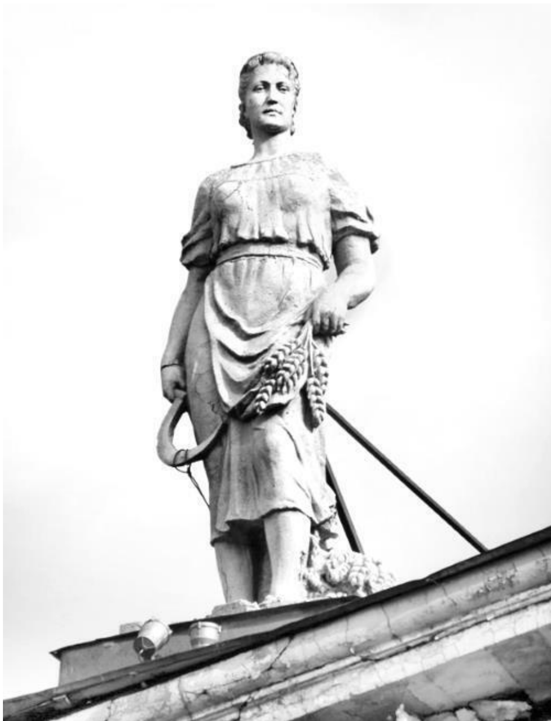
Женская скульптура на доме 68 по Невскому проспекту