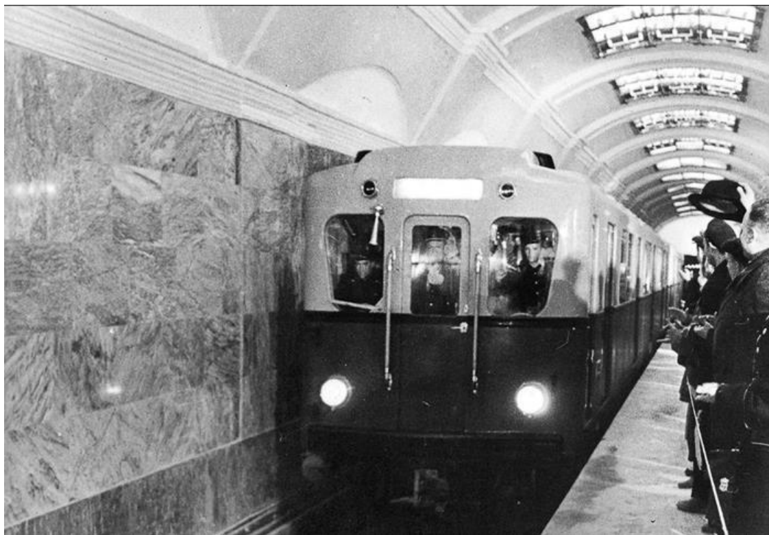
Пробный поезд. Октябрь 1955 г.

По истечении срока замораживания воду из тоннеля откачали. По всему периметру и в торце образовался слой льда, который при сильном освещении блестел и переливался всеми цветами радуги. Благодаря дополнительному замораживанию удалось без аварий к 20 сентября завершить проходку тоннеля. Но до пуска метро оставалось всего полтора месяца, за это время невозможно было произвести отделку наклонного хода и монтаж эскалаторов. Принимается непростое решение: начать эксплуатацию линии без станции «Пушкинская», которую поезда должны проходить без остановки.