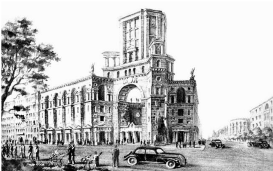
Проект здания Управления Ленинградского метрополитена и станции «Горьковская». 1944 г.

На основании приказа Министерства путей сообщения СССР № 317-ц от 17 апреля 1946 г. Управление строительства № 5 переименовывается в Управление строительства Ленинградского метрополитена «Ленметрострой» Главтоннельметростроя МПС СССР. Его начальником вместо погибшего на войне И.Г. Зубкова назначается Константин Александрович Кузнецов, который во время Великой Отечественной войны командовал мостовосстановительным отрядом № 1. Под его руководством бойцы восстановили 39 железнодорожных мостов через Днепр, Днестр, Волгу, Южный Буг, Молдову и другие реки.