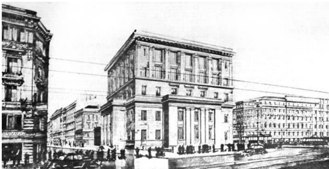
Проект реконструкции Знаменской церкви. 1940 г.