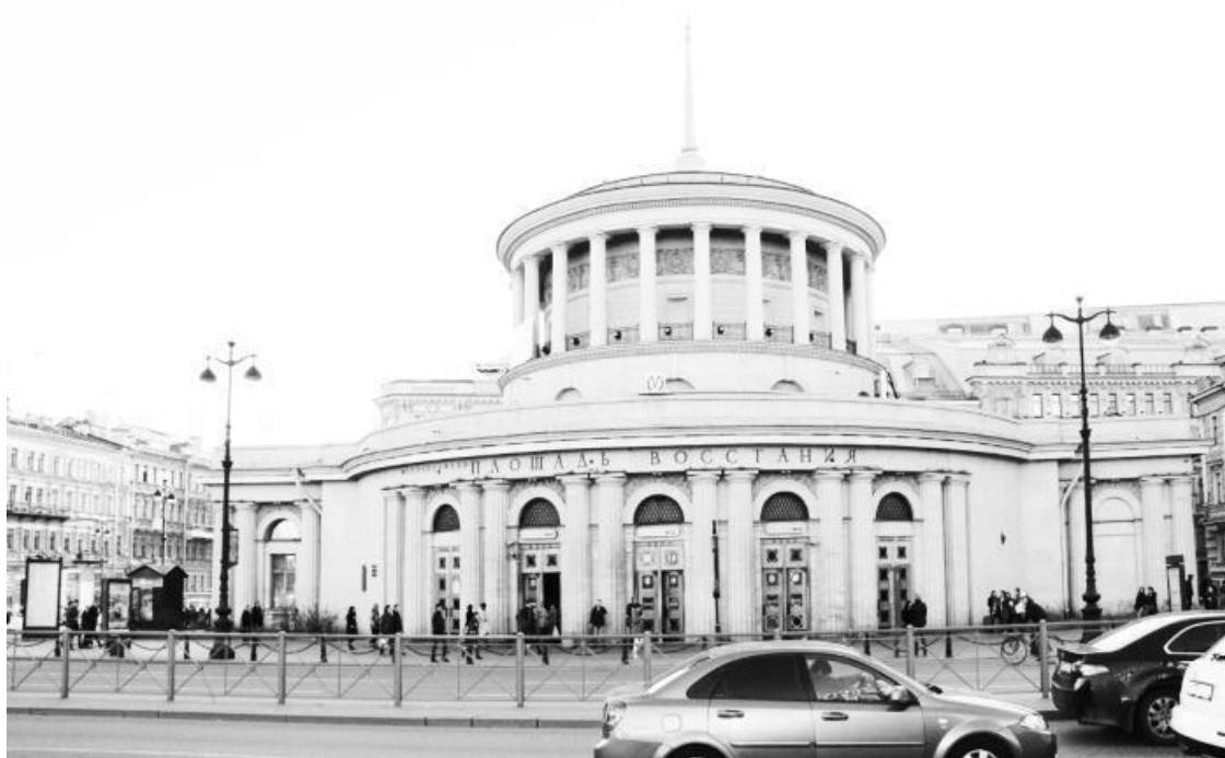
Станция «Площадь Восстания»

Станция «Площадь Восстания» первая еще и потому, что с нее обычно начинается знакомство с нашим городом гостей, прибывающих на Московский вокзал. Здание станции с высоким шпилем, расположенное на пересечении Лиговского и Невского проспектов, хорошо знакомо многим, и не только жителям нашего города. Оно давно стало одним из символов Петербурга и главным символом Петербургского метрополитена. Станция «Площадь Восстания», по официальной статистике, – одна из самых загруженных, находится в центре города, выходит к оживленному Московскому вокзалу и является пересадочной на третью линию.