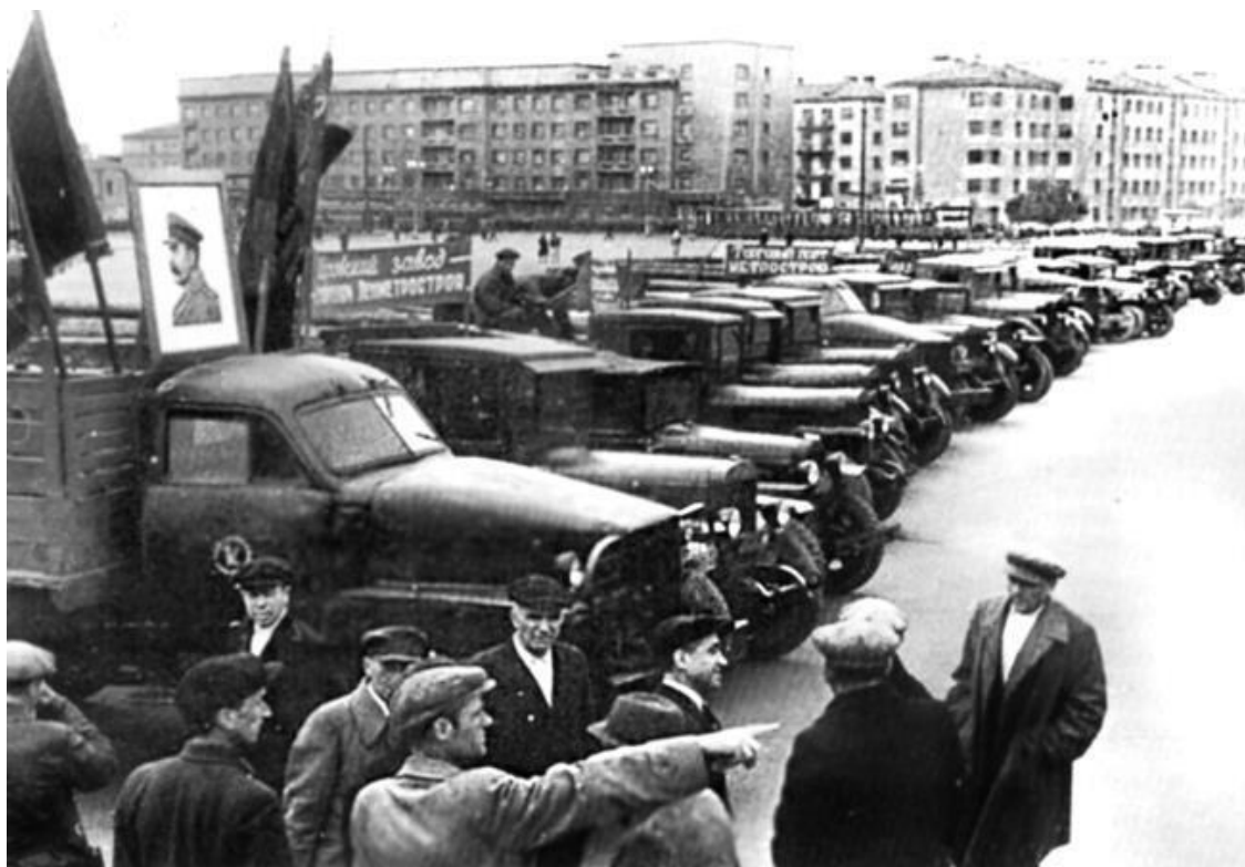
Колонна автомашин – шефская помощь предприятий Ленинграда – направляется на строительство метрополитена. 3 сентября 1947 г.

Попытки городского руководства добиться в Москве увеличения финансирования строительства метрополитена заканчивались ничем. На Пленуме Ленинградских обкома и горкома ВКП(б) 22 февраля 1949 г. председатель Ленгорисполкома П.Г. Лазутин, осужденный позднее по «ленинградскому делу», в своем выступлении оправдывался: «Известно, что этот вопрос мы долгое время пытались решить через т. Вознесенского (Н.А. Вознесенский – заместитель председателя Совета Министров СССР, также осужден по «ленинградскому делу». – А. Ж.). Наши усилия на это направляли до тех пор, пока я не попал к т. Берия, который указал, что такие вопросы не решаются в рабочем порядке, канцелярским путем, вопрос о метро большой хозяйственной и политической важности не только для Ленинграда, но и для всей страны, он должен быть прежде всего рассмотрен на Политбюро. Действительно, через несколько дней тов. Сталин принял нас... Не по нашей инициативе, а по инициативе тов. Сталина был рассмотрен на Политбюро вопрос о Ленинградском метро, после доклада, который был сделан т. Берия т. Сталину. На Политбюро были подробно рассмотрены все вопросы, относящиеся к строительству метро, и принято соответствующее решение о Ленинградском метро».