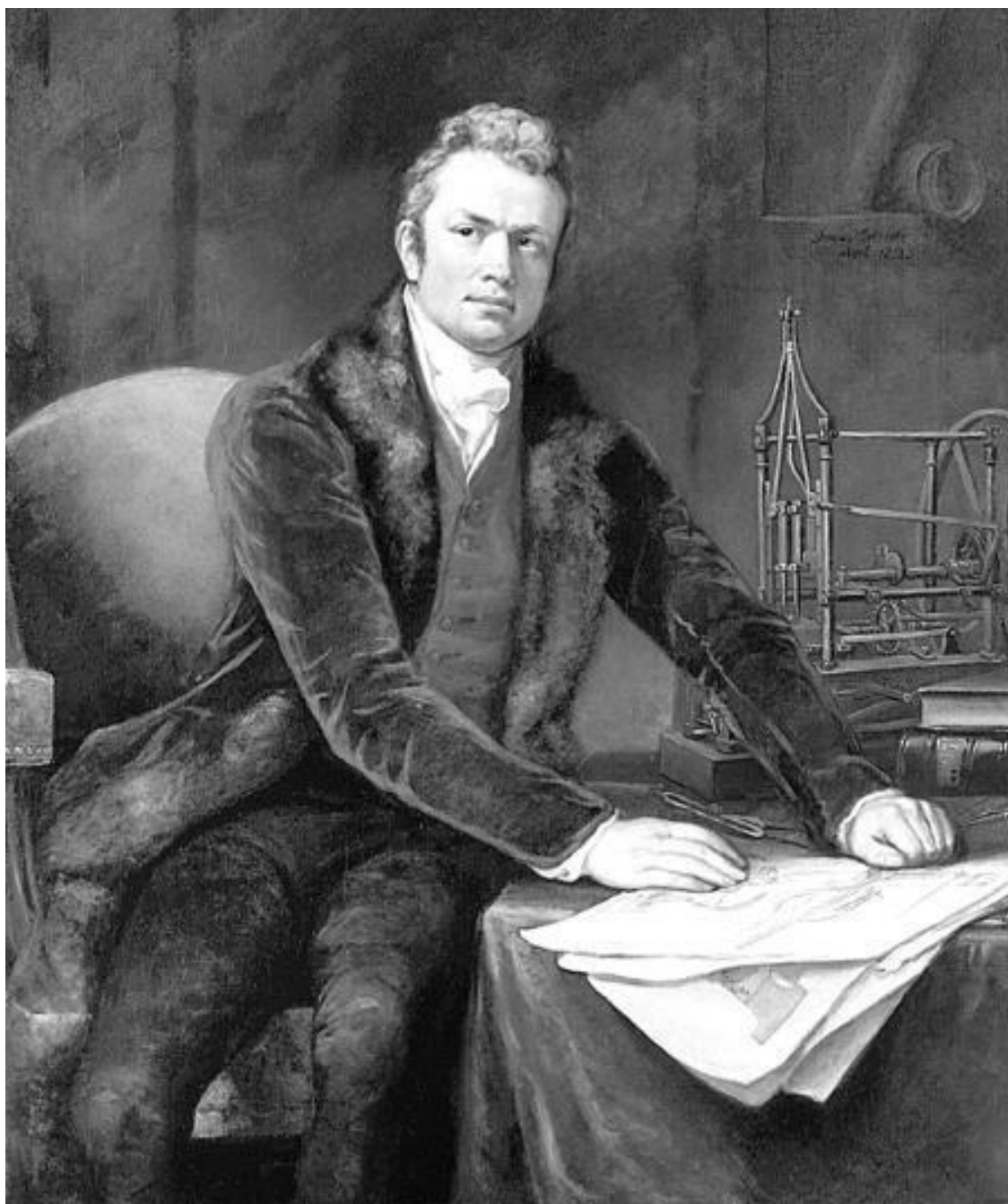
Марк Изамбар Брюнель. С портрета Джеймса Норткота