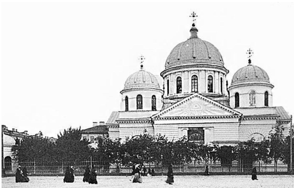
Церковь Знамения Пресвятой Богородицы. Конец XIX в.

Вестибюль станции «Площадь Восстания» находится на месте снесенной церкви во имя Входа Господня во Иерусалим, получившей в народе название Знаменской по приделу, освященному в 1765 г. в честь иконы Знамения Пресвятой Богородицы, самой чтимой святыни храма, исполненной в 1175 г. в Новгороде греком Христофором Семеновым. В церкви икона сохранялась в старинном серебряном окладе, на возвышении.