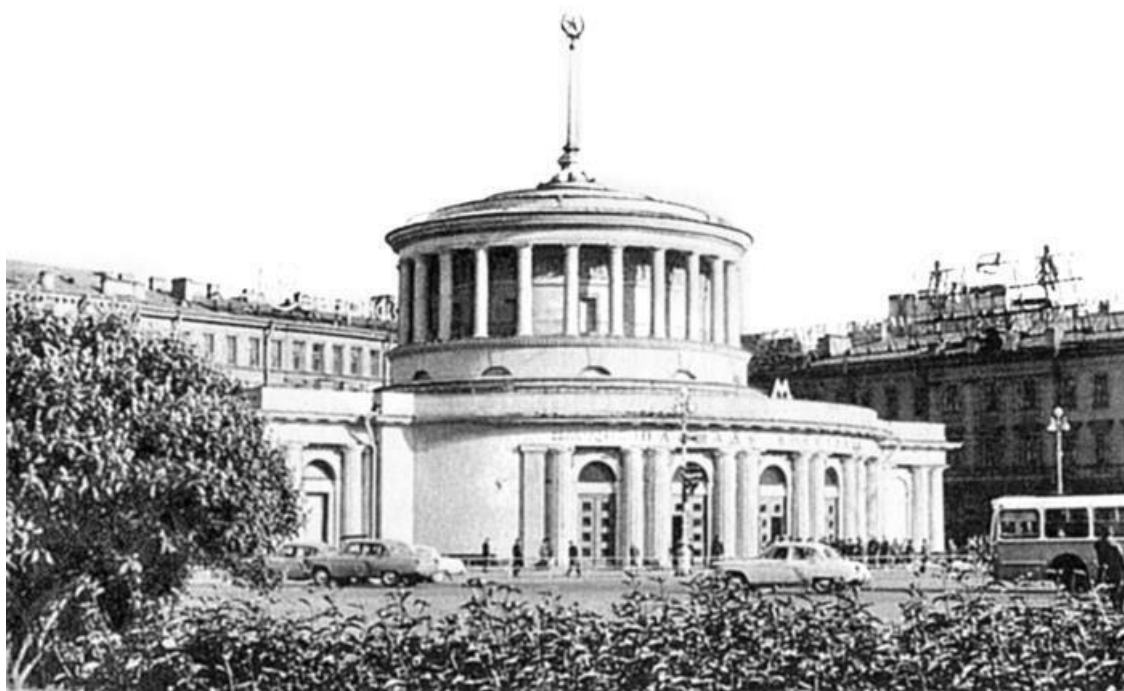
Станция «Площадь Восстания». 1960-е гг.

улица Восстания ниже) входные двери находятся в одном уровне с тротуаром, а вот выходные выходят на стилобат.