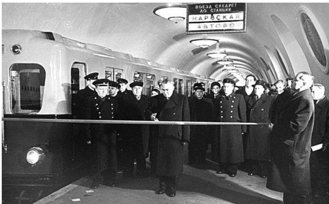
Торжественное открытие ленинградского метрополитена. 15 ноября 1955 г.

В те дни шла горячая работа на всех участках: укладывались последние гранитные и мраморные плиты, завершался монтаж эскалаторов, устанавливались светильники, приводились в порядок станционные залы и наземные вестибюли, устранялись недоделки, отмеченные рабочей комиссией.