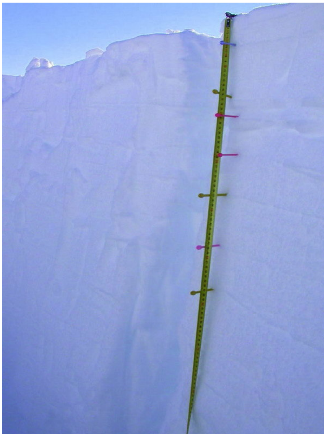
Измерение высоты снежного покрова