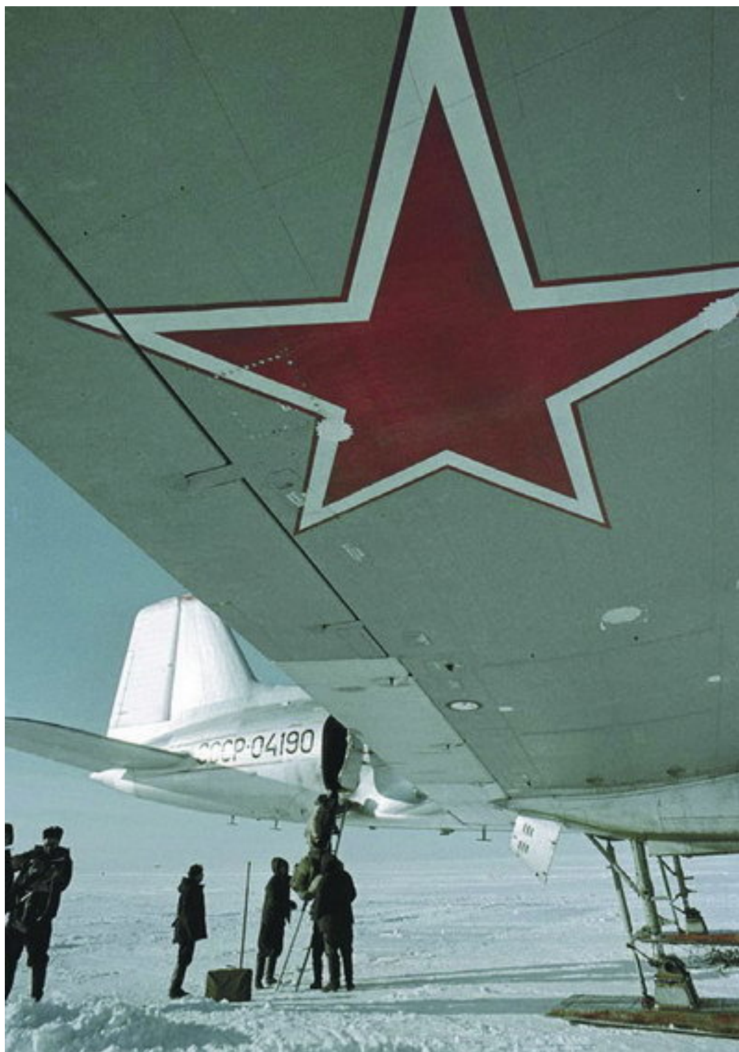
Доставка самолетом ИЛ-14 людей и грузов в Антарктиду