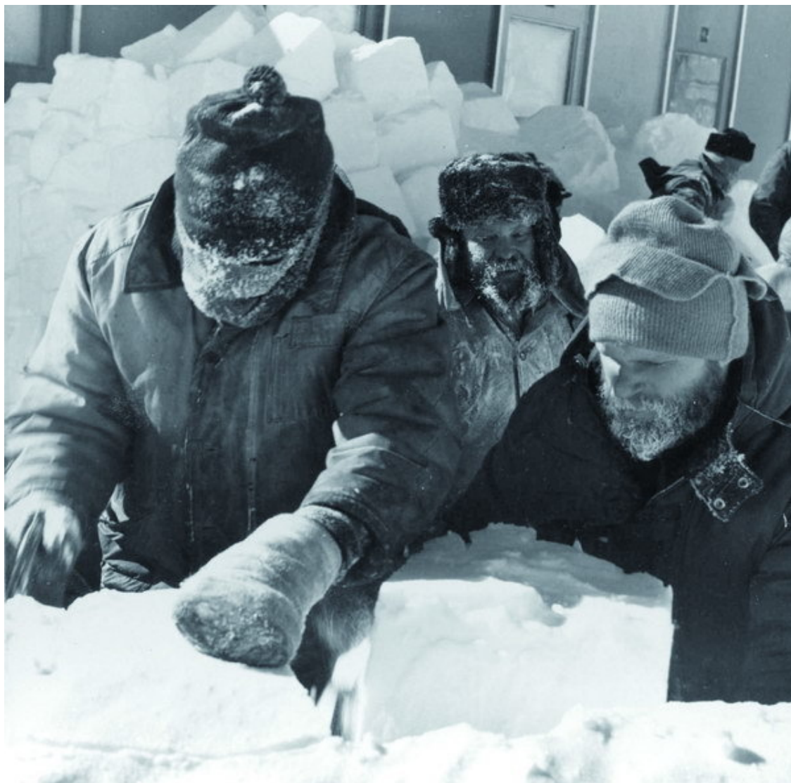
Заготовка снега на станции Восток

Через 137 лет, в 1957 году, никто из создателей станции и подумать не мог, что именно здесь, в самом сердце Антарктиды, где зимой царит жесточайший холод, под многокилометровой ледяной толщей будет обнаружен уникальный реликтовый водоем – озеро, названное впоследствии Восток. Итак, станция «Восток» была заложена 16 декабря 1957 года. Эта дата стала примечательной для станции и другим событием – в этот день была зафиксирована самая высокая температура – минус 13,6 градуса по Цельсию. До сего дня так «тепло» на станции больше не было.