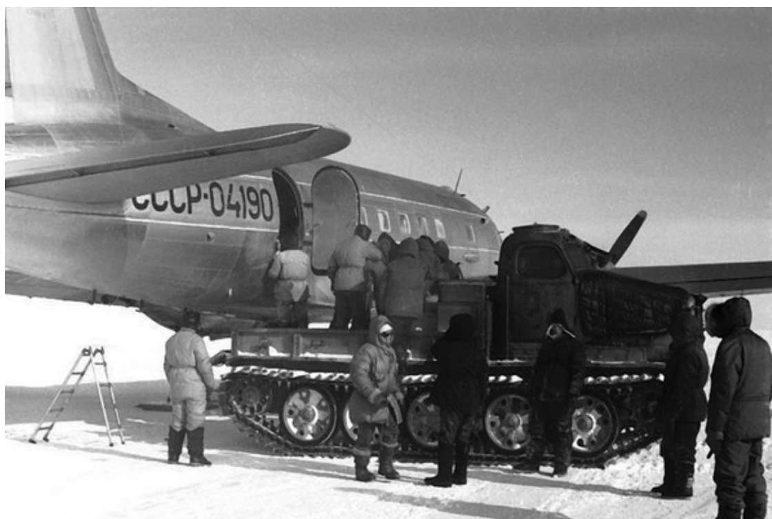
Разгрузка ИЛ-14 на ВВП станции Восток