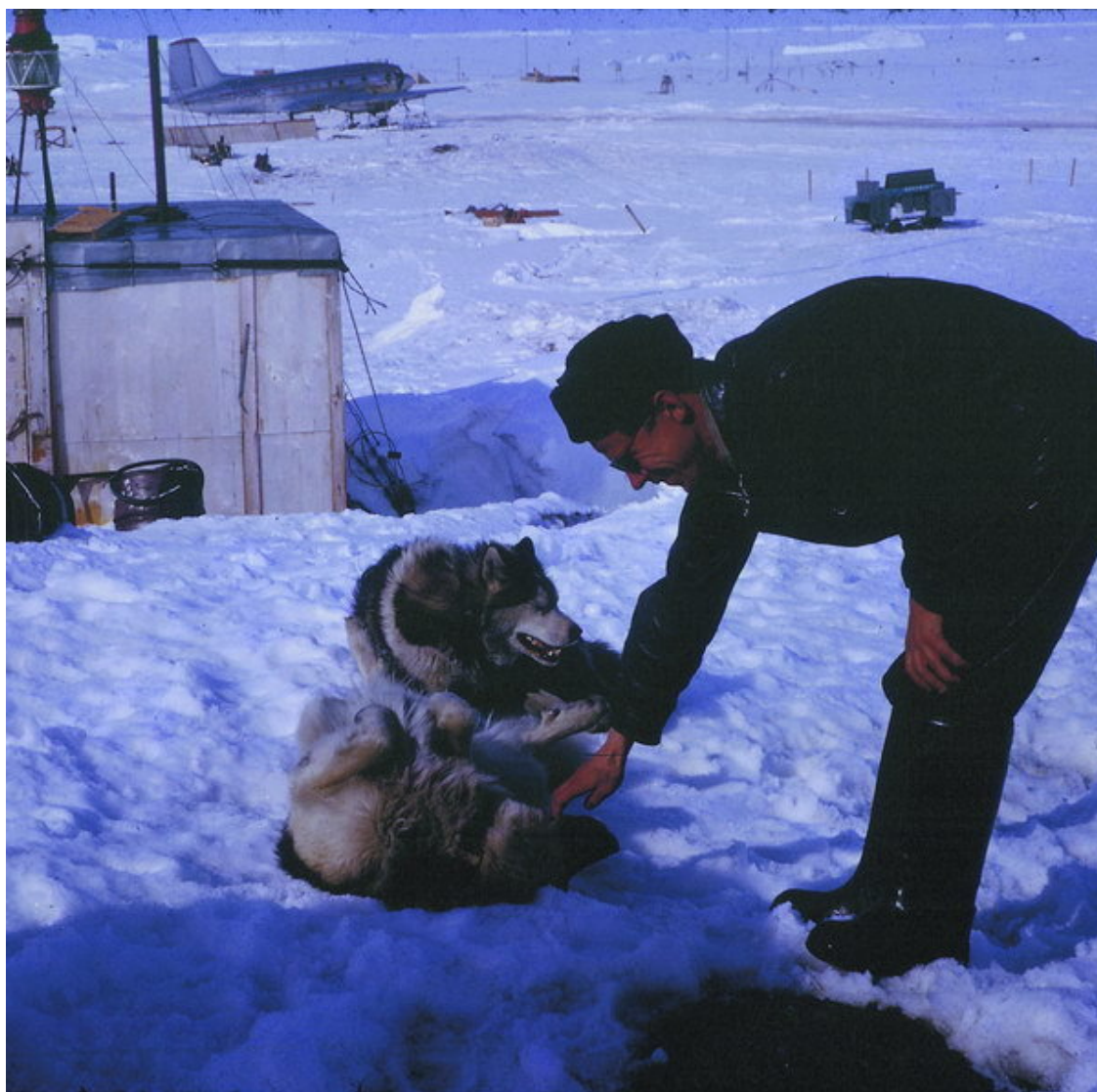
Станция Восток. 1950-е гг.

Сразу же вслед за тем, как на «Востоке» был поднят флаг, начались постоянные комплексные метеорологические и аэрологические наблюдения (первая метеотелеграмма была отправлена уже 16 декабря). Позднее ученые проводили вертикальное зондирование ионосферы, геомагнитные измерения, наблюдение за полярными сияниями, измерение содержания озона и спектральной прозрачности атмосферы, наблюдения за космическими лучами и медицинские исследования. Именно благодаря метеонаблюдениям станция «Восток» стала всемирно знаменитой, а ее название записано во всех школьных учебниках по географии: 21 июля 1983 года здесь был зарегистрирован абсолютный минимум приземной температуры воздуха на планете, равный -89,2^{\circ}\text{C} .