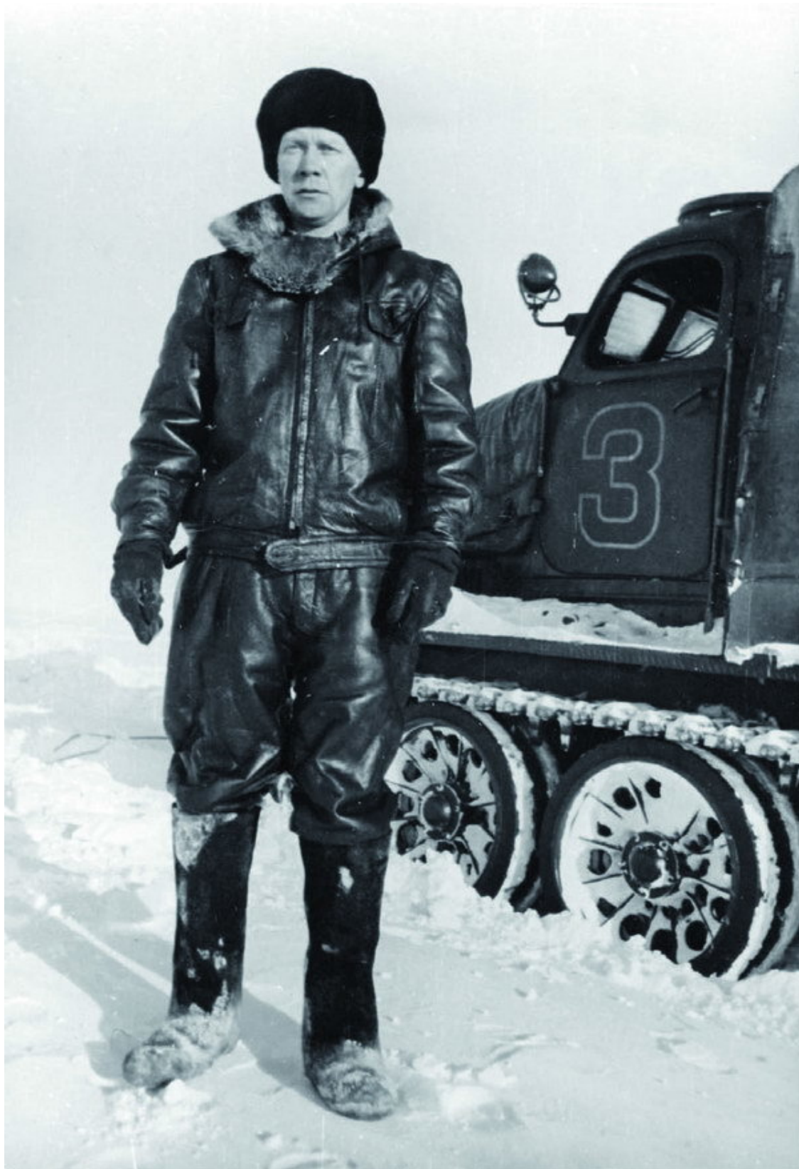
Вячеслав Аверьянов, начальник станций Восток и Восток-1. 1957 год