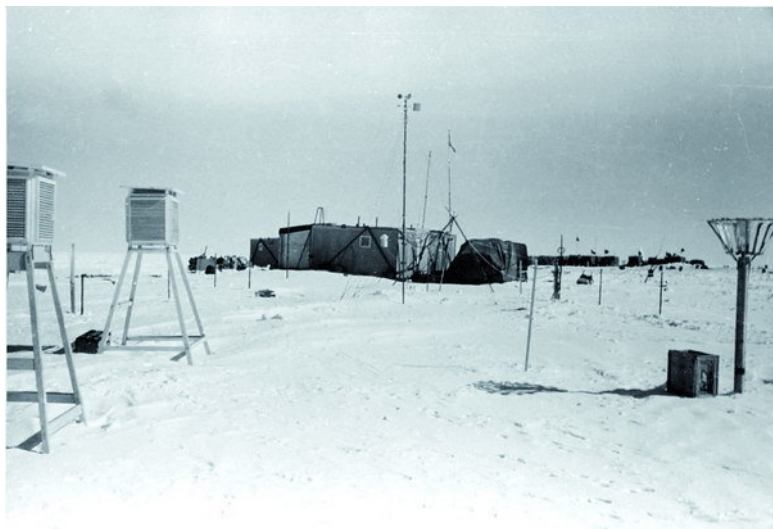
Станция Восток. 1957 год

тиды, где зимой царит жесточайший холод, под многокилометровой ледяной толщей будет обнаружен уникальный реликтовый водоем – озеро, названное впоследствии Восток. Итак, станция «Восток» была заложена 16 декабря 1957 года. Эта дата стала примечательной для станции и другим событием – в этот день была зафиксирована самая высокая температура – минус 13,6 градуса по Цельсию. До сего дня так «тепло» на станции больше не было.