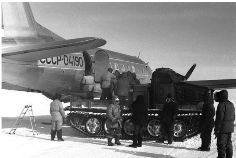
Разгрузка ИЛ-14 на ВВП станции Восток