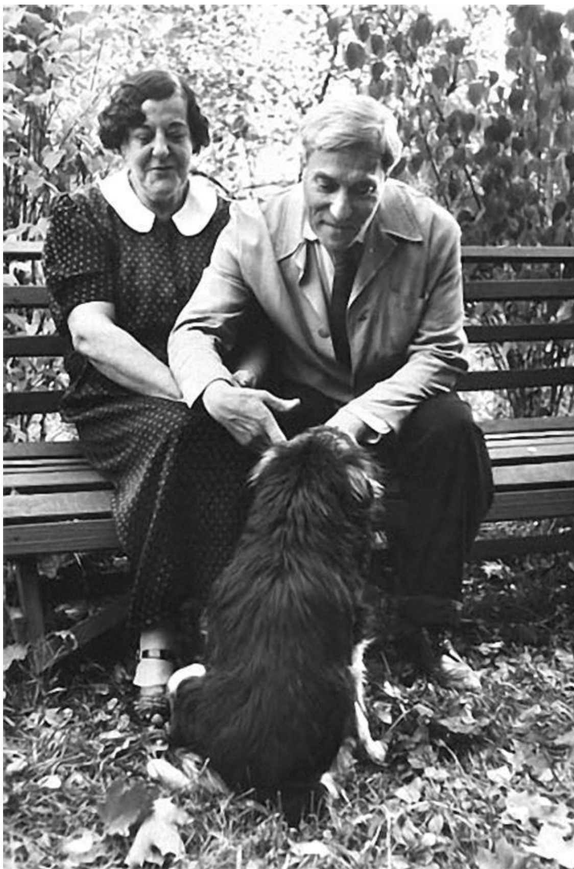
Борис Пастернак и Зинаида Нейгауз. 1950-е гг.

Не волнуйся, не плачь, не труди Сил иссякших, и сердца не мучай.