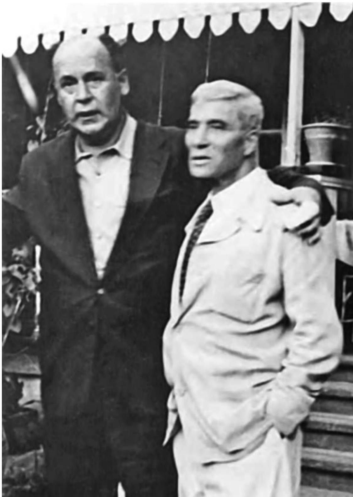
Борис Ливанов и Борис Пастернак. 1958 г.