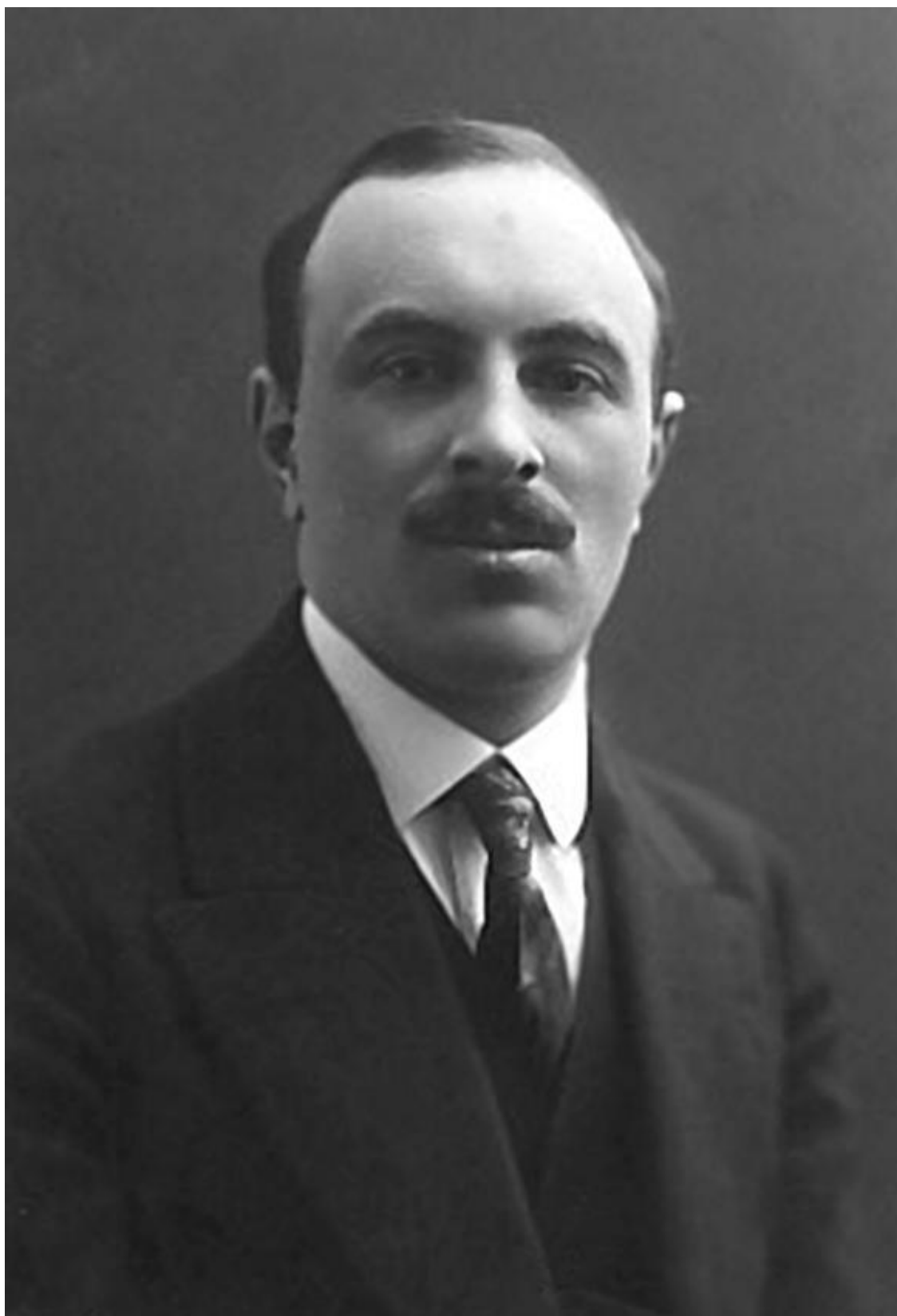
Василий Григорьевич Сахновский (1886–1945) – русский советский театральный режиссер, театровед, педагог. Народный артист РСФСР (1938). Доктор искусствоведения (1939)

В ливановском архиве имеется черновик письма, записанного О. Бокшанской под диктовку Ливанова и предназначавшегося кому-то из бдительных начальников советского искусства.