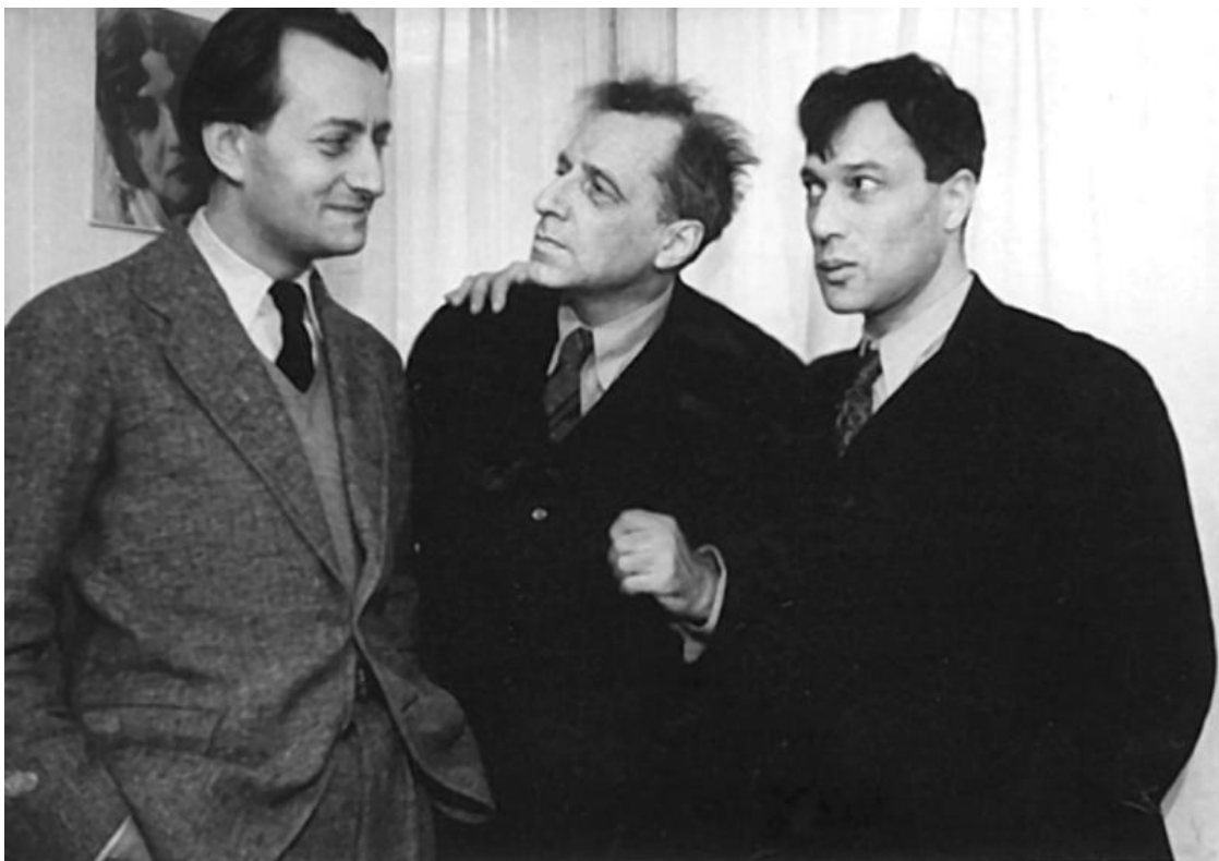
Андре Мальро, Всеволод Мейерхольд, Борис Пастернак. 1936 г.

18 июня 1941 года Пастернак надписывает Ливанову первое издание шекспировской трагедии в своем переводе: