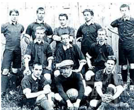
На снимке: первая сборная города