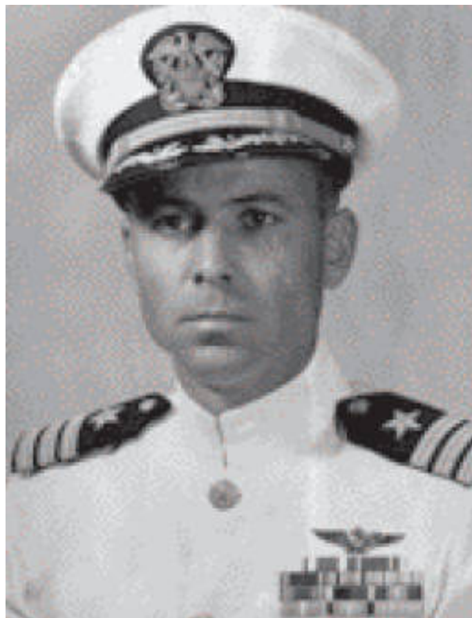
Роберт Дейл. Американский летчик и исследователь Антарктиды...