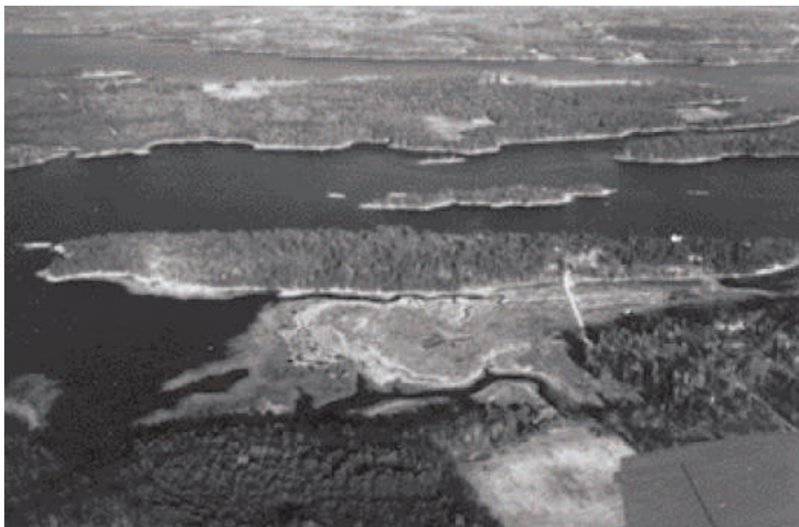
Остров Хакамок в ихерах атлантического побережья северной части США. Здесь началась работа над рукописью «Зимних солдат»

Только две неприятности и запомнились мне от того времени. Одна была связана с белочкой. Она каким-то образом выскочила на улицу и перебралась на ближайшее дерево аллеи. Ребята всего поселка с радостным свистом и гамом бежали за ней от дерева к дереву, но так и не остановили ее, и белочка убежала в лес. Это наша-то белочка!