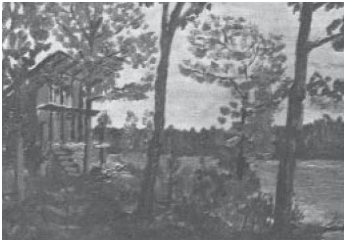
Дом Боба Дейла на острове Хакамок

Здесь же на столе стоит небольшая, сделанная из бронзы, покрытая зеленью скульптура: лошадь высотой около четверти метра. Странная лошадь, свободно мчащаяся без узды и поводьев с немислимым для животного выражением счастья на морде. Так могут изображать животных только какие-нибудь китайцы, подумалось мне.