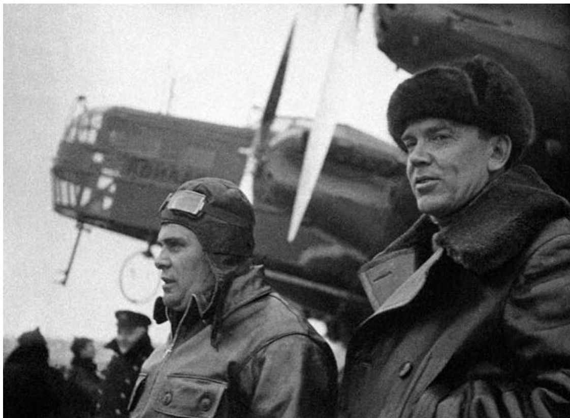
Водопьянов и Кренкель

Принят был следующий вариант: тяжёлые самолёты садятся на многолетние льды в районе полюса и выгружают экспедицию со всем оборудованием. М.В. Водопьянов, изучив дневники Пири, Нансена и Бэрда, пришёл к твердому убеждению: в приполюсном районе место для посадки подыскать вполне возможно. Вместе с докладной запиской он написал целую повесть под названием «Мечта пилота», опубликованную издательством «Молодая гвардия». К слову, в тот день, когда через год Водопьянов совершил посадку на полюсе, в московском Реалистическом театре состоялась премьера спектакля по этой книге.