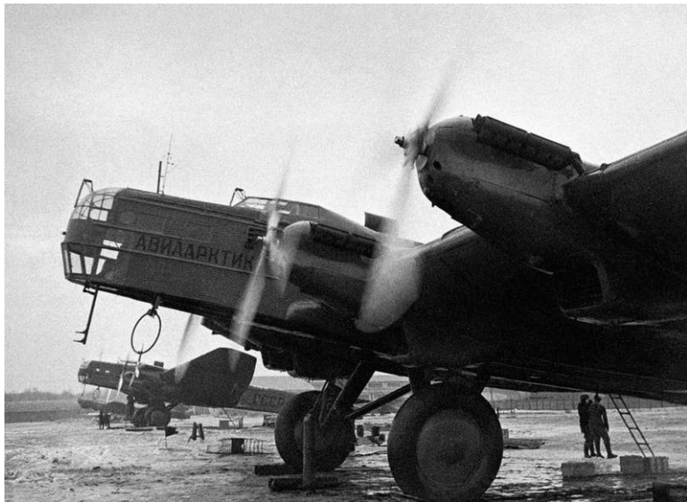
Флагманский самолет экспедиции