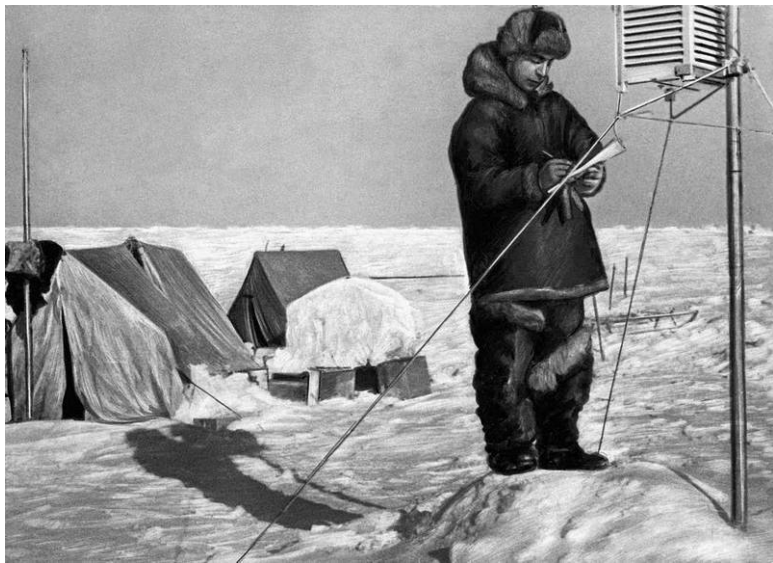
Фёдоров снимает показания метеоприборов