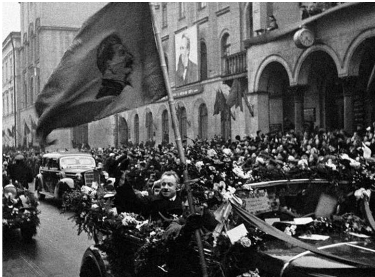
Встреча героев-напавцев в Ленинграде