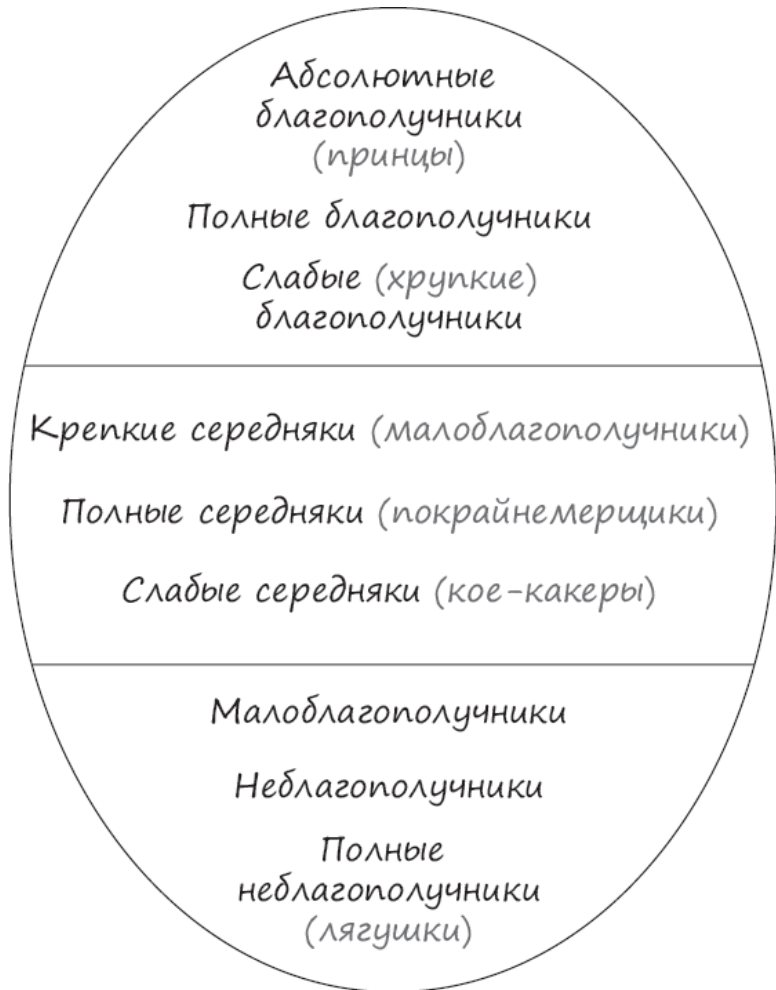
Рис. 2. Уровни благополучия с подуровнями