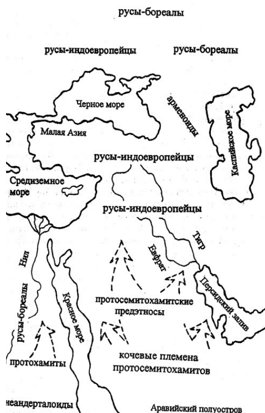
Этническая карта 6–5 тыс. до н.э. Выдвижение первых кочевых предэтносов к ареалам расселения русов