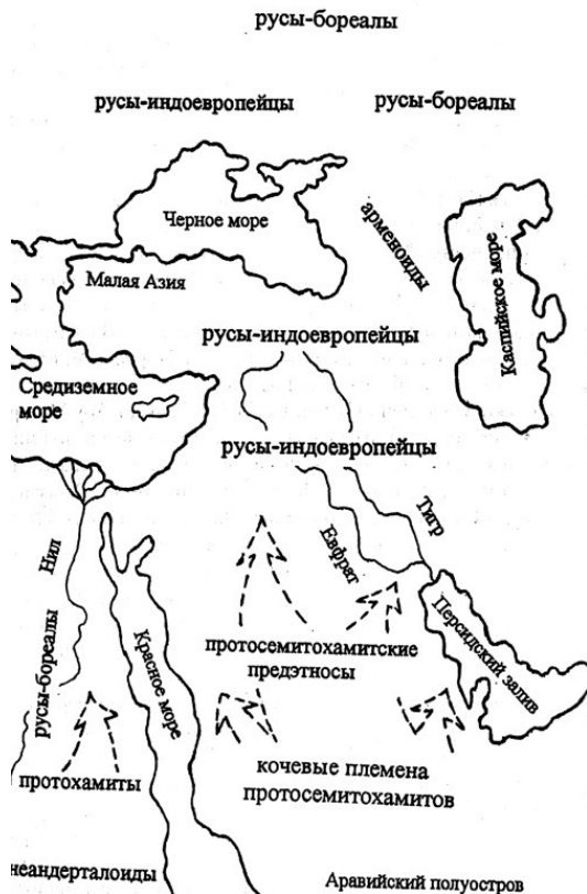
Рисунок 2 по Ю.Д. Петухову

Что представляли собой протосемиты на своей прародине, в Аравии? Никаких построек, культовых зданий, могиль-