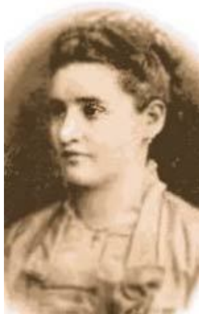
Знаменитая пациентка Анна О.

Французская школа невропатологии располагала богатым клиническим материалом и неординарными успехами в изучении гипноза и истерии, но в Вене эти исследования были встречены довольно скептически. Поэтому Фрейд решает отправиться в Париж, чтобы лично пройти обучение у Шарко. Шарко уделял большое внимание миру фантазий больного, он утверждал, что причины истерии заключены в психике, а не в физиологии. В одной из бесед с Фрейдом он замечает, что, по его мнению, причины болезни невротика кроются в особенностях его половой жизни. Эти идеи, сопоставленные с наблюдениями самого Фрейда, а также с памятным случаем Анны О., наводят его на мысль о существовании особой сферы психики, скрытой от сознания, но оказывающей большое влияние на нашу жизнь. Причем состоит эта