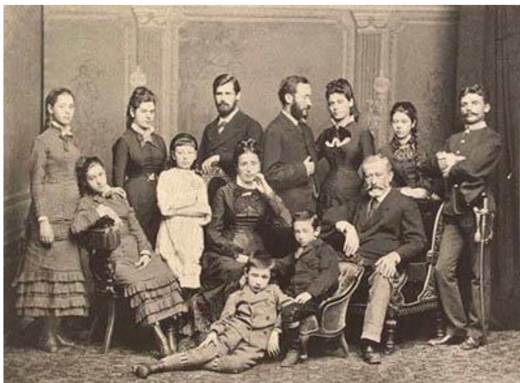
Семья Фрейда. З. Фрейд по центру, за матерью, 1878 г.