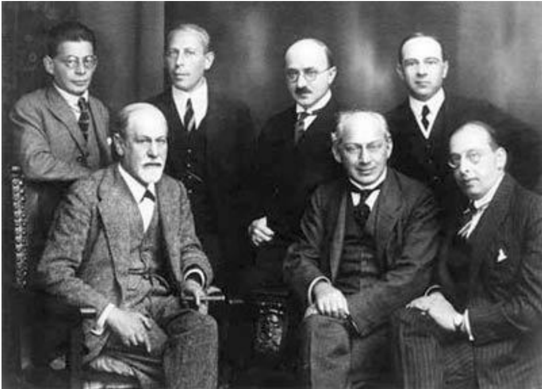
Тайный комитет психоанализа (слева направо): О. Ранк, К. Абрахам, М. Эйтингон, Э. Джонс, З. Фрейд, Ш. Ференци, Г. Закс

Психоаналитическое учение о культуре представляет собой способ истолкования знаков, семиотику или даже симптоматику культуры. Психоанализ развивался по следующему направлению: от терапии неврозов и метода исследования бессознательных психических процессов к «метапсихологии», то есть совокупности теоретических постулатов о человеческой психике и «судьбах влечений». Затем эта общая теория послужила фундаментом для применения психоанализа в различных областях знания: в этнографии, религиоведении, социальной психологии и социологии.