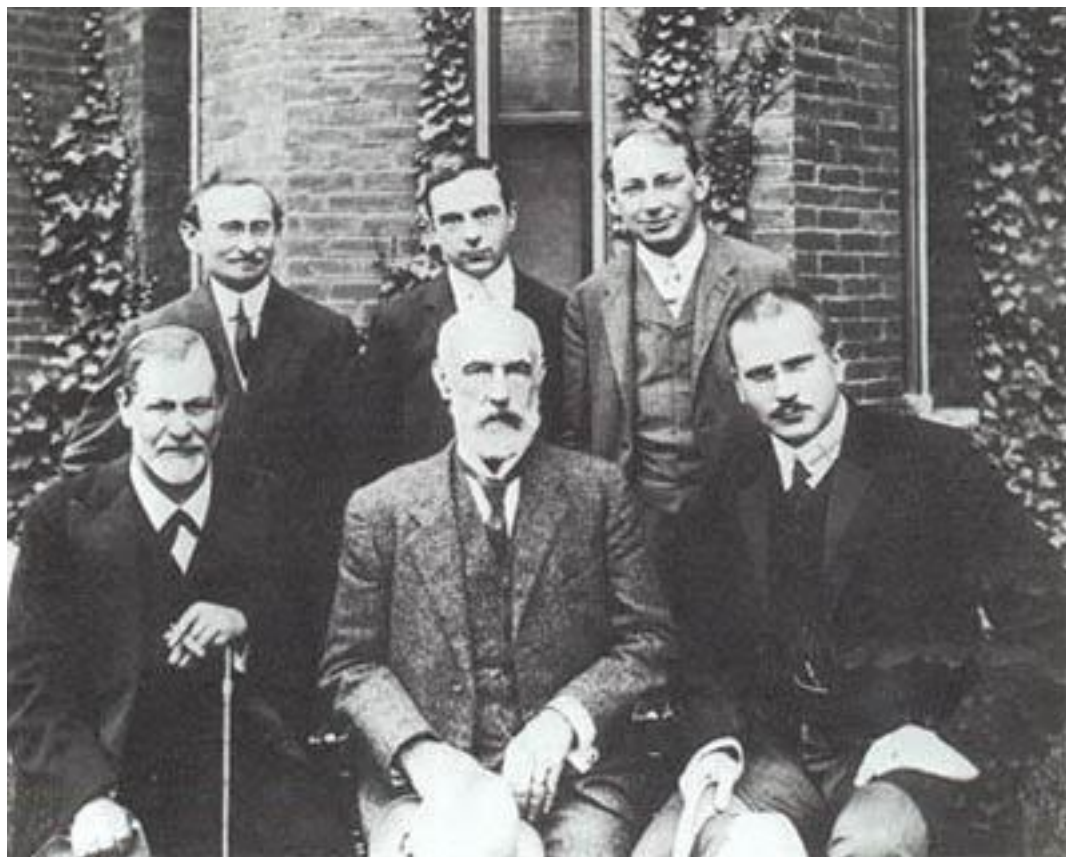
Основатели психоанализа с президентом Университета Кларка. З. Фрейд – в первом ряду слева

Возникнув в начале века, одно из направлений медицинской психологии, психоанализ, сначала усилиями З. Фрейда, а затем и его последователей постепенно превратился в учение, претендующее на оригинальное решение чуть ли не всех мировоззренческих проблем. Одновременно он стал частью повседневного существования миллионов людей в Западной Европе, и в особенности в США.