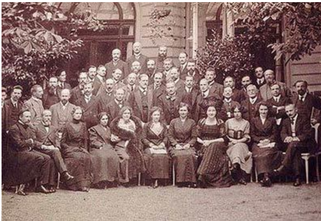
Участники 3-го Международного психоаналитического конгресса в Веймаре, 1911 г.

Истолкование сновидений представляет собой «королевскую дорогу» психоанализа, а само сновидение может быть парадигмой всех шифров, уловок влечений, так как в сновидении происходит регрессия психического аппарата к архаичному, изначальному – мы возвращаемся к нашим детским влечениям, а они суть наследия первобытности.