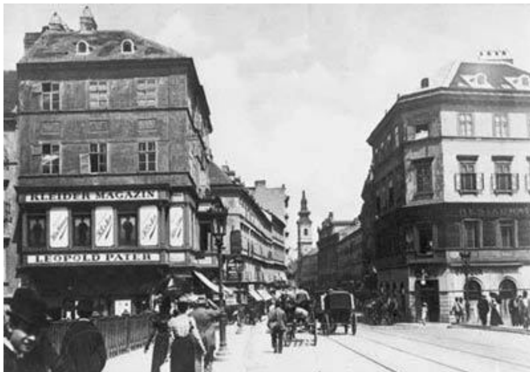
Табор стрит, район Вены, где жил З. Фрейд с 1891 по 1938 гг.