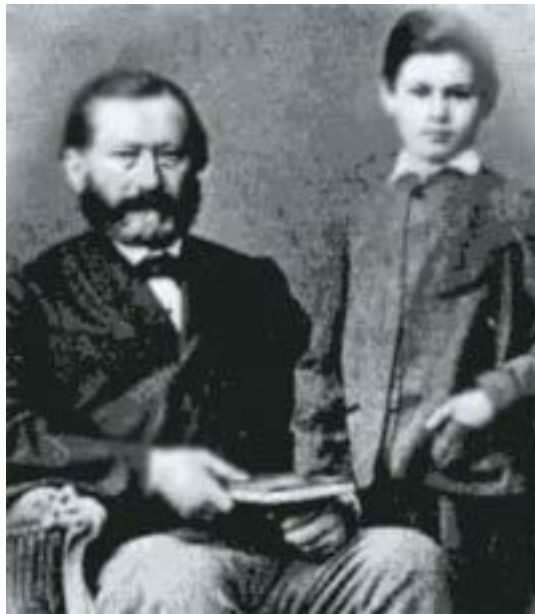
8-летний З. Фрейд с отцом

Зигмунд Фрейд родился 6 мая 1856 г. в небольшом моравском городе Фрайберге в семье небогатого торговца шерстью. В 1860 г. семья переехала в Вену, где будущий знаменитый ученый прожил около 80 лет. В большой семье было 8 детей, но только Зигмунд выделялся своими исключительными способностями, удивительно острым умом и страстью к чтению. Поэтому родители стремились создать для него лучшие условия. Если другие дети учили уроки при свечах, то Зигмунду выделили керосиновую лампу. Чтобы дети ему не мешали, им не позволяли при нем музицировать. Он окончил гимназию с отличием в 17 лет и поступил в знаменитый Венский университет на медицинский факультет.