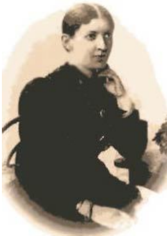
Жена З. Фрейда – Марта Бернейс