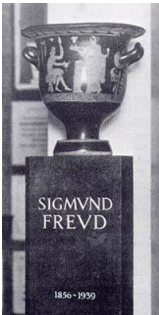
Урна с прахом З. Фрейда в Лондоне

В начале 20-х гг. судьба вновь подвергает Фрейда тяжелым испытаниям: у него развивается рак челюсти, вызванный пристрастием к сигарам. Тревожная социально-политическая обстановка порождает массовые беспорядки и волнения. Фрейд, оставаясь верен естественно-научной традиции, все чаще обращается к темам психологии масс, психологическому устройству религиозных и идеологических догматов. Продолжая исследовать бездны бессознательного, теперь он приходит к выводу, что два одинаково сильных начала управляют человеком: стремление к жизни (Эрос) и стремление к смерти (Танатос). Инстинкт разрушения, силы агрессии и насилия слишком явно проявляют себя вокруг, чтобы их не заметить.