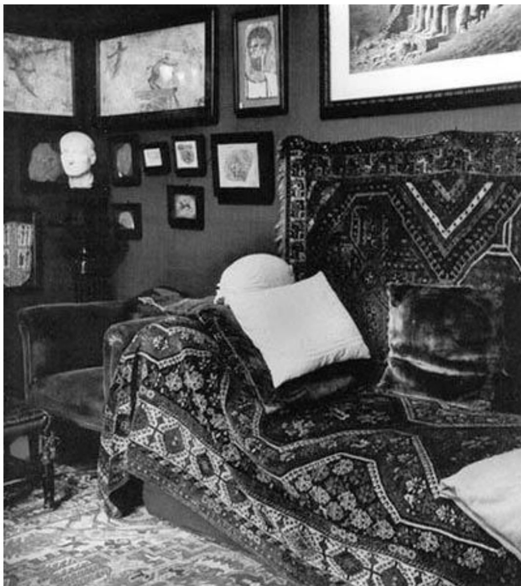
Психоаналитическая кушетка З. Фрейда в Вене

Однако К. Г. Юнг смел и независим в своих суждениях, и он вступает в спор со своим учителем. В результате собственных исследований и наблюдений Юнг не может согласиться с тем, что основной силой, движущей волей и желаниями всего человечества, является энергия сексуального влечения, обозначенная Фрейдом термином «либидо». Юнг также использует этот термин, но он понимает под ним энергию более общего, глобального характера, некую основополагающую «жизненную силу» как таковую. Отношения, начавшиеся взаимным восхищением, кончаются судебным процессом. По требованию Фрейда Юнг «отлучен» от психоанализа и вынужден назвать свой метод психотерапии по-другому: «аналитическая психология».