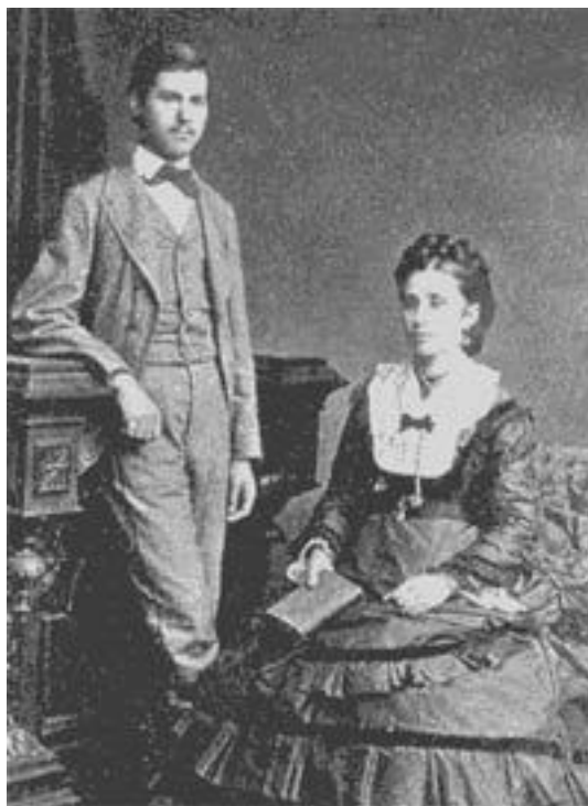
16-летний З. Фрейд с матерью