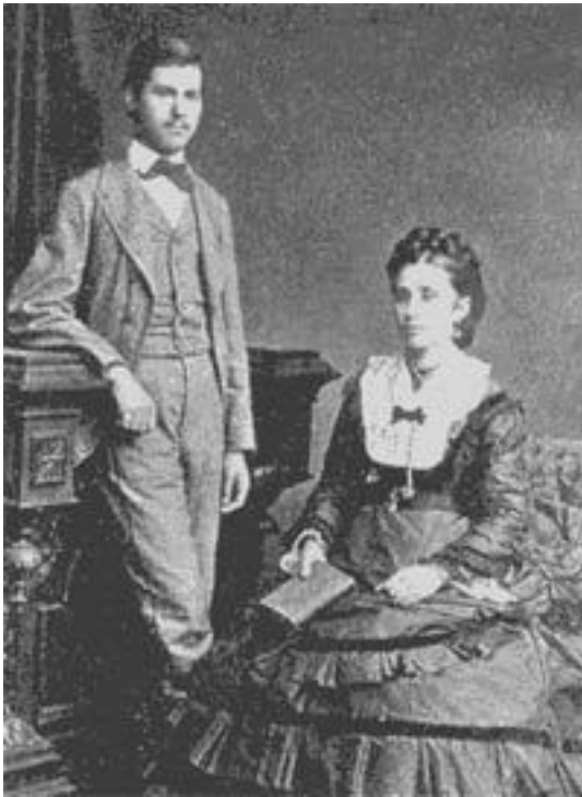
16-летний З. Фрейд с матерью

Во время обучения в университете Фрейд вошел в студенческий союз по изучению истории, политики, философии. Однако особый интерес для него представляли естественные науки, достижения которых произвели в середине прошлого века настоящую революцию в умах, заложив фундамент современного знания об организме, о живой природе.