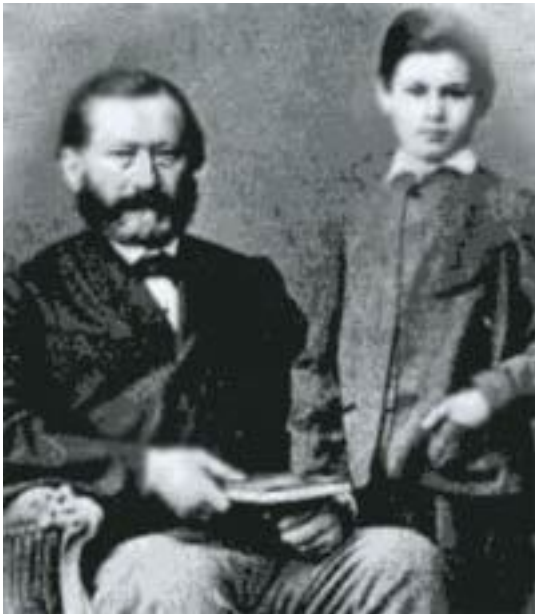
8-летний З. Фрейд с отцом