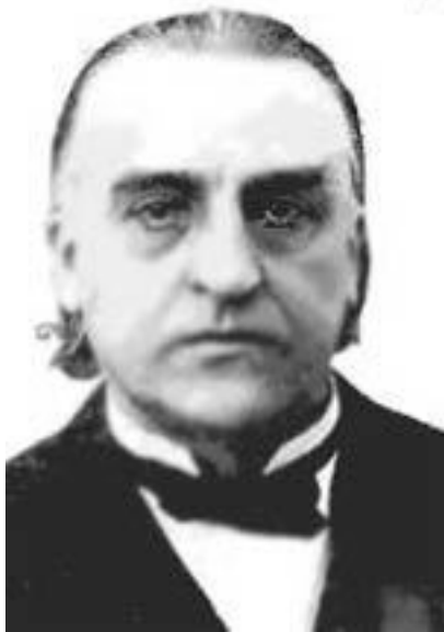
Французский врач Ж. Шарко