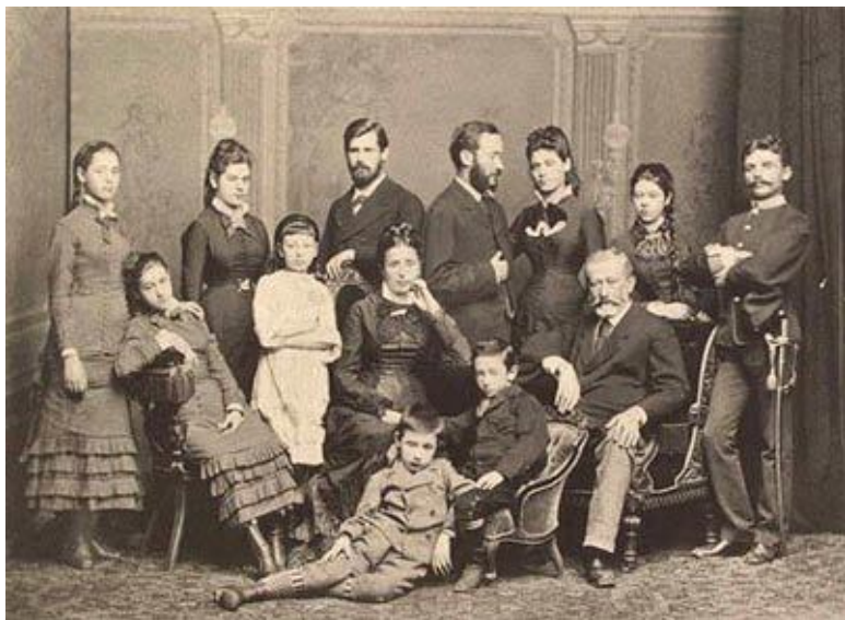
Семья Фрейда. З. Фрейд по центру, за матерью, 1878 г.

Фрейд приобретает репутацию высококвалифицированного врача-невропатолога. Своих больных он лечил принятыми в то время методами физиотерапии. Считалось, что поскольку нервная система представляет собой материальный орган, то и болезненные изменения, которые в ней происходят, должны иметь материальные причины. Поэтому устранять их следует посредством физических процедур, воздействуя на больного теплом, водой, электричеством и др.