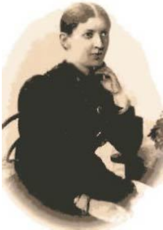
Жена З. Фрейда – Марта Бернейс