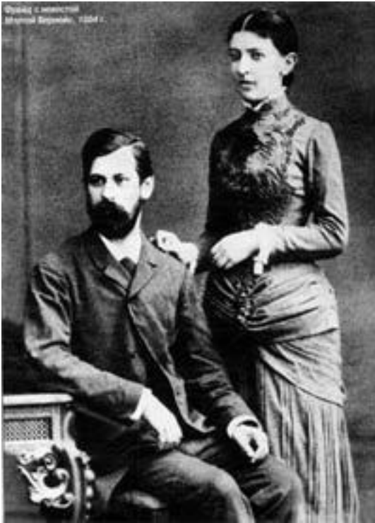
3. Фрейд с невестой М. Бернейс, 1884 г.

реальностью» вынуждено прилагать все свои усилия для гармонизации отношений между этими тремя его «хозяевами».