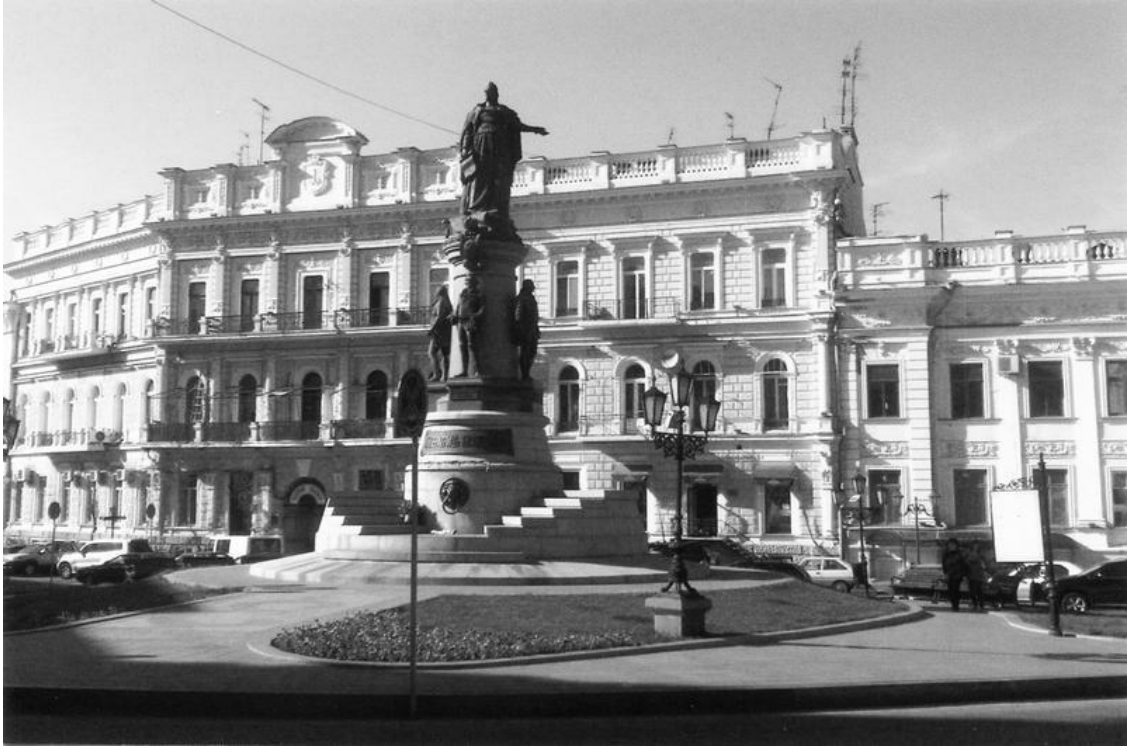
Памятник императрице Екатерине Великой (Скульптор М. Попов, архитектор Ю. Дмитренко)

Из еврейских праздников мне больше всего запомнилась еврейская Пасха – Пейсах. В первый и второй вечер вся семья садилась за праздничный стол. На столе в отдельном блюде были поставлены кушанья: несколько видов бутербродов из мацы, заполненных хреном, яйцами и еще какими-то горькими травами. Отец разъяснял, что это должно напоминать тяжелое положение еврейского народа, находившегося в рабстве у египтян. И эти маленькие бутерброды нужно было есть, чтобы ощутить то далекое и тяжелое время.