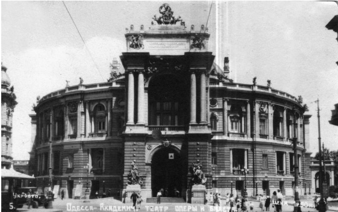
Гордость Одессы – оперный театр. (Архитекторы Ф. Фельнер, Г. Гельмер)

На следующий же день, прикрепив с помощью отца ролики к ботинкам, я отправился на асфальтированную дорожку недалеко от дома и стал учиться сначала стоять, а потом двигаться. Конечно, домой пришел с многочисленными ушибами и синяками, но был счастлив. Ни у кого из моих сверстников не было таких коньков.