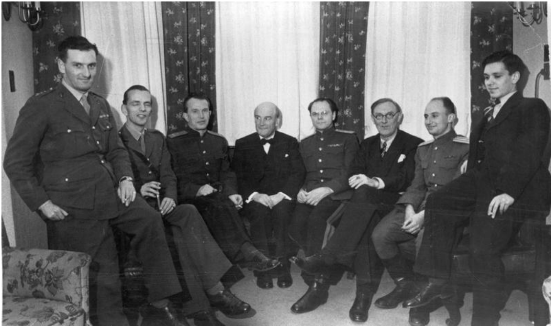
Международный военный трибунал

приходилось выезжать на читательские конференции. Книгу выдвинули на Ленинскую премию. Его приятелями стали многие представители «высшего света».