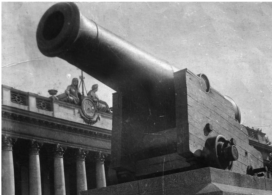
На Приморском бульваре стоит подлинная, времён Крымской войны 1854–55 годов, чугунная пушка с затонувшего у берегов Одессы английского фрегата «Тигр»