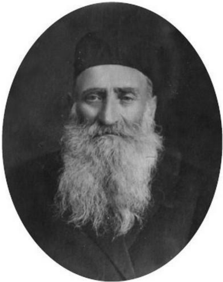
Дед Шимон – сельский учитель