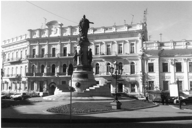
Памятник императрице Екатерине Великой (Скульптор М. Попов, архитектор Ю. Дмитренко)

Родители были религиозными людьми. Каждый день у отца начинался с молитвы. Он надевал на себя молитвенное облачение: на лоб и на локоть тфилин (черные кожаные корбочки с кожаными ремнями), на плечи набрасывал талес (шаль). И так каждое утро. По субботам отец всегда ходил в синагогу, молился там. Домой возвращался с двумя бедными людьми, которых надо было покормить.