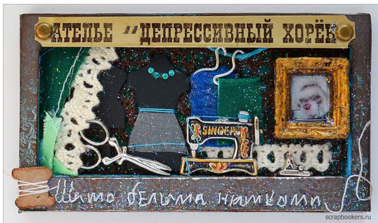
АТЕЛЬЕ «ДЕПРЕССИВНЫЙ ХОРЕК»

К верхнему краю визитки прикреплена жестяная табличка, на которой шрифтом, типичным для печатных машинок, выбито: