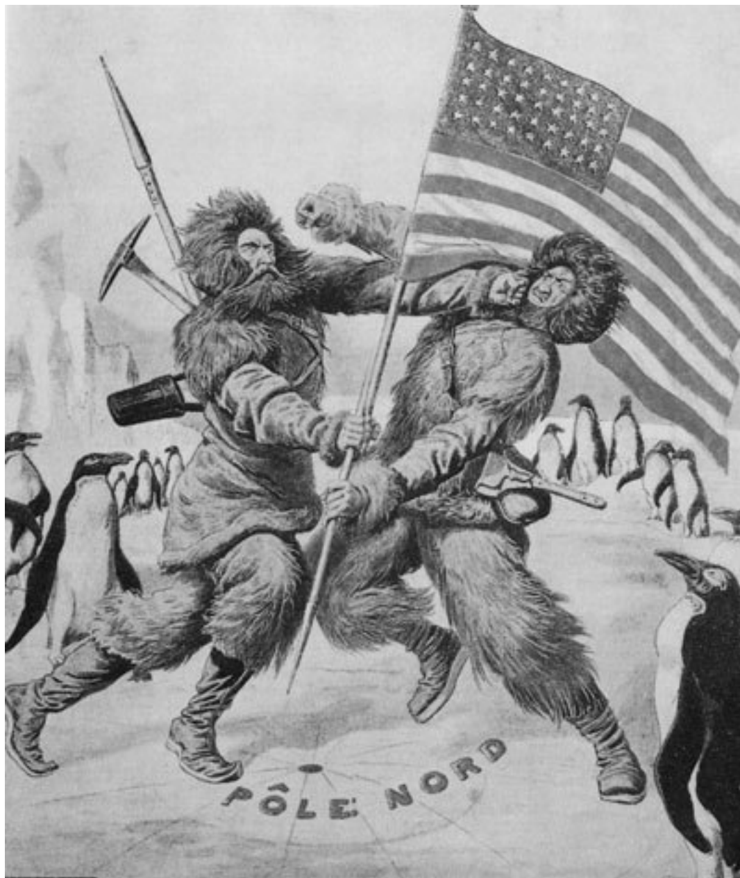
Пири и Кук борются за первенство в открытии Северного полюса в окружении... пингвинов. Французская карикатура