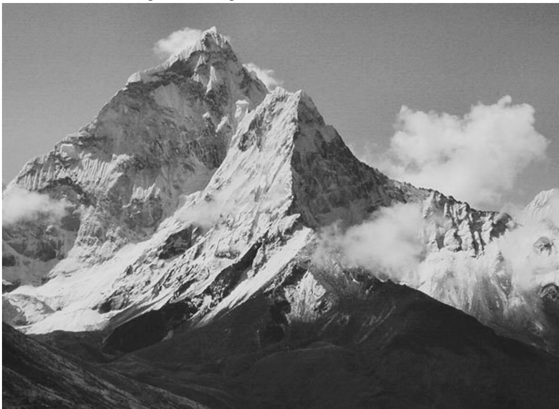
Эверест (Джомолунгма) – высочайшая вершина земного шара

Тибетцы зовут эту вершину Джомолунгма («Мать-Богиня Мира»). Когда англичане визу-ально обследовали ее со стороны Индии, то назвали в честь своего губернатора (отличавшегося высокой должностью, а не ростом) Эверестом.