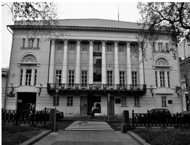
ГМИНВ на Никитском (Суворовский б-р). Москва. Фото 1998 г.