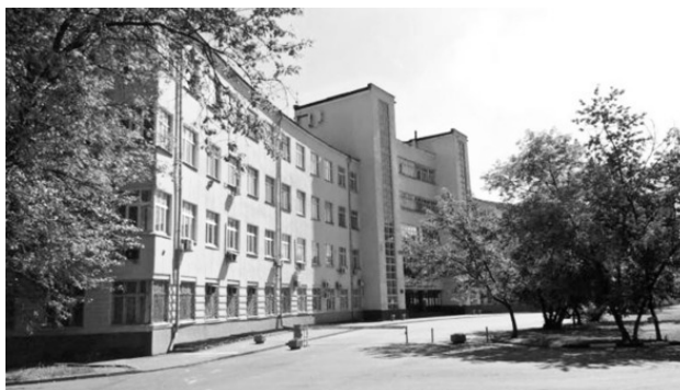
МЭИС. Фото 2001 г.

ством, к тому же на сложнейший факультет радиоэлектроники. МЭИС был абсолютно технический ВУЗ с мощной военной кафедрой. Живописи там, казалось, и в помине нет места, но это только на первый взгляд.