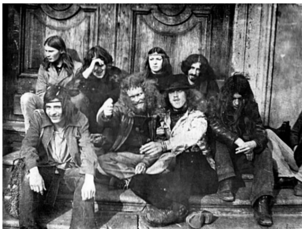
Москва. Хиппи начала восьмидесятых XX века.