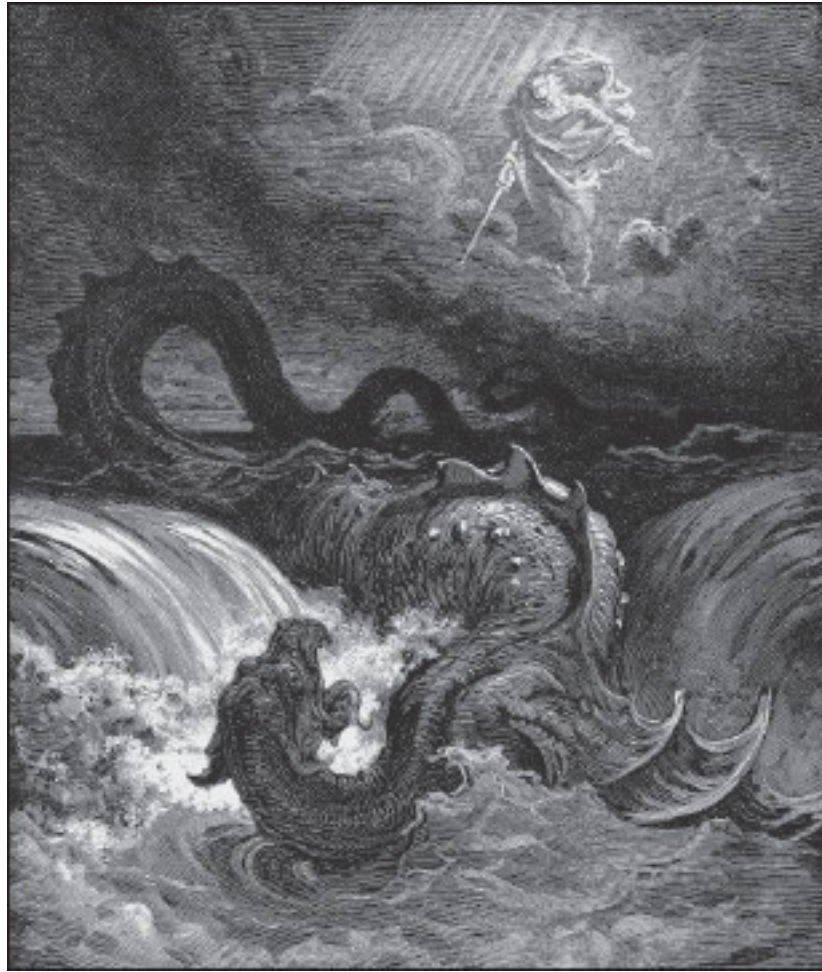
Г. Доре. Убийство Левиафана. 1865 г.

В допленные времена рассказ о разделении вод звучал иначе. Следы старого мифа мы можем обнаружить в 73 псалме, в книге пророка Исаии (Ис. 27, 1), а в наиболее полном виде в Книге Иова (41; 2—26). В тот момент, когда Яхве приступил к своему труду, море вскипело как котел, и из пучины на поверхность поднялся исполинский Левиафан – наполовину змей, наполовину крокодил. Из его ужасной пасти вырывалось пламя и выскакивали искры, из ноздрей валил дым, глаза сверкали яростью. Вид чудовища внушил трепет даже сонму небесных ангелов, но Яхве извлек Левиафана из глубины, схватил его за язык и вдел в нос кольцо. Так укрощен был этот демон океана, навсегда сделавшийся рабом Господа.