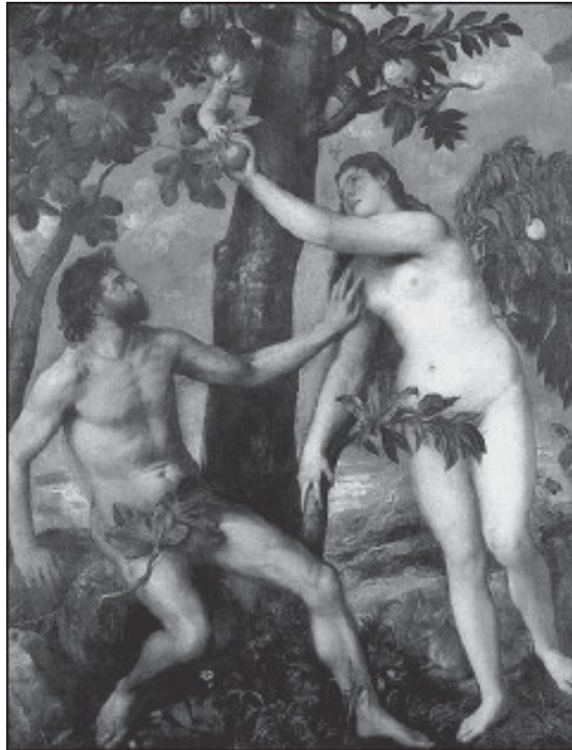
Тициан. Адам и Ева

В третий день творения Бог отделил воду от суши и назвал сушу землею, а воду морем. И увидел Бог, что это хорошо. И тогда Он велел произрасти из земли деревьям, приносящим плоды, и травам, сеющим семя. От этого покрылась она зеленью и наполнился воздух шелестом листьев и трав.