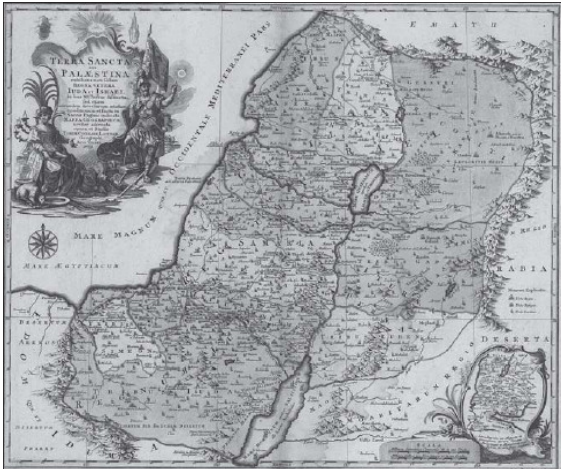
Святая земля и 12 колен израилевых на карте М. Лоттера (1759 г.)

К востоку от нагорья с севера на юг тянется глубокая Впадина (одна из самых глубоких на земле). Постепенно понижаясь, она достигает в районе Мертвого моря своей наибольшей глубины – 392 м ниже уровня мирового океана. По дну Впадины протекает река Иордан , берущая свое начало с горы Хермон (вершина которой почти всегда покрыта снегом). В верхнем течении, расширяясь, река образует Геннисаретское (Галилейское) озеро . В древности его берега были покрыты роскошной растительностью, а воды изобиловали рыбой, оттого здесь всегда имелось густое население.