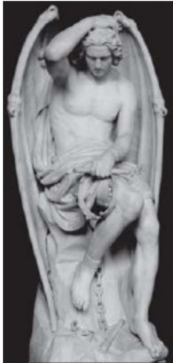
Люцифер. Скульптор Г. Геефс

ство вечного испепеляющего огня и нестерпимого холода. Здесь Люцифер обрел новое имя – Сатана. Мятежный подданный Бога, он так и не смог создать ничего нового. Затаившись на задворках мира, Сатана тщится обратить против Всевышнего полученное от Него же могущество. Но разве под силу кому-либо поколебать красоту создаваемой Богом вселенной? Совершая свои проделки, дух зла, сам не желая того, продолжает служить Богу и содействует исполнению Его сокровенного замысла. (Некоторые апокрифы утверждают, что Сатана вообще не был Божьим творением; в этих книгах он выступает изначальным воплощением тьмы, которая якобы существовала задолго до творения и не просто как отсутствие Света, но как некая сущность.)