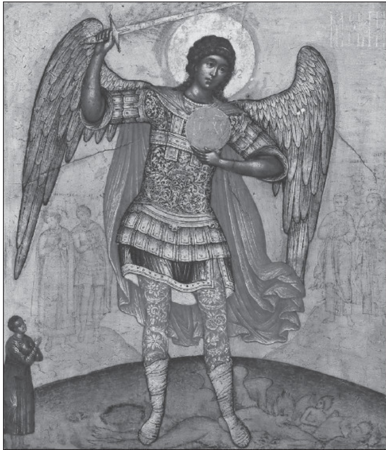
Архангел Михаил, попирающий дьявола. Икона, 1676 г.