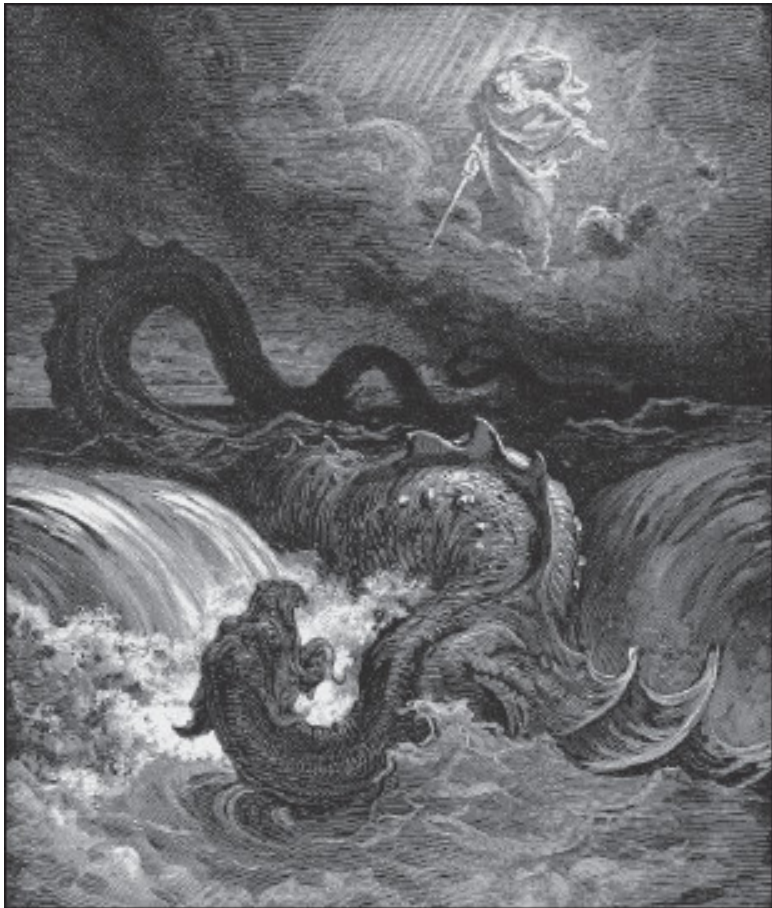
Г. Доре. Убийство Левиафана. 1865 г.