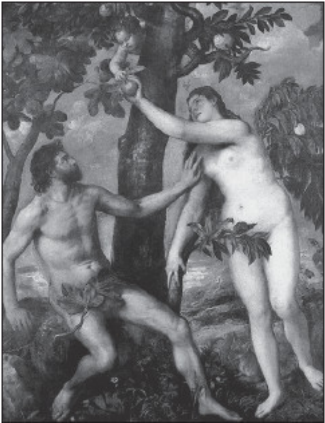
Тициан. Адам и Ева

В четвертый день Бог сказал: «Да будут на небе светила, освещающие землю!» И стало так. Для дня Бог создал солн-