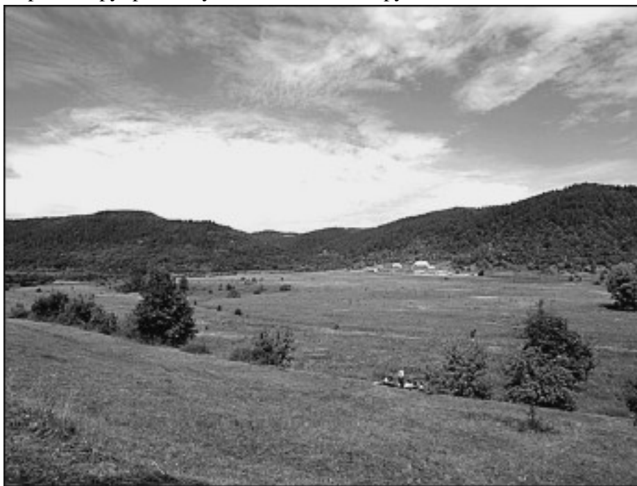
Самарская земля хранит много тайн

Интересно, кому первому пришла в голову идея перегородить степь? Трудно поверить, что императорским сановникам. Во-первых, здравомыслящий человек поймет: таким способом орду кочевников не остановишь. Во-вторых... Вот мы просто вдоль насыпи идем, и то на десятом километре уже устали. А если бы мы тут с лопатами продвигались? Экскаваторов-то при Татищеве не было... Не проще ли ему укрепить людское поселение по периметру, чем ставить столь дорогостоящий заслон? Скорее всего, тогдашние переселенцы-россияне всего лишь местами реконструировали уже имеющееся сооружение. Чье?