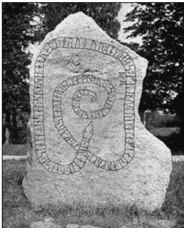
Рунический камень из Грисхольма

Но жизнь его вскоре оборвалась при стрессовой ситуации, когда Владимир собирался в поход на непокорный Новгород, где сидел один из его сыновей Ярослав. Сразу же после кончины великого князя завязалась упорная борьба между наследниками, большая часть которых погибла от рук своей же братии. Особенно упорной была война Ярослава Новгородского со Святополком Киевским, которого летописец именует Окаянным. Возможно, не без воли Ярослава пущен был слух о том, что Святополк не был сыном Владимира. Согласно этой версии, он был рожден от убитого варягами князя Ярополка, законного наследника престола, в отличие от Владимира, сына наложницы Малуши.