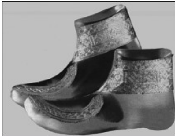
Кельтские сапоги со славянским орнаментом