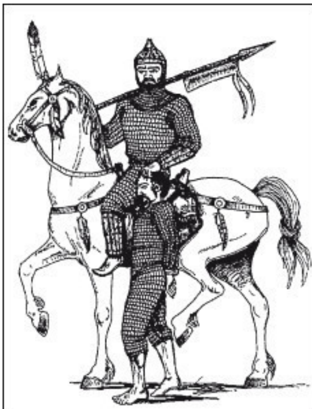
Хазарский воин, ведущий пленника. Рисунок на сосуде IX в.

Археологи копали на Дону, на Волге, на Кавказе – увы, ничего. Словно хазары были не люди, а призраки, а города их, словно таинственный Китеж, бесследно провалились сквозь землю. В Лету канула целая империя!