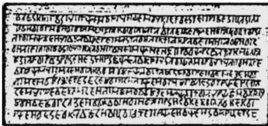
Прорисовка одной из дощечек Велесовой книги