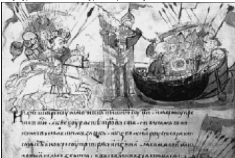
Осада русами во главе с Аскольдом и Диром Константинополя. Миниатюра из Радзивилловской летописи. XV в.

Эти набеги на каспийский бассейн приходились обязательно на весну, когда едва сходил лед на степных реках. Ниже мы объясним, почему именно в апреле надо было прорываться на Каспий, пока же покажем варианты этих маршрутов с их волоками меж истоками рек. При выходе из Днепра русы использовали русла двух его притоков.