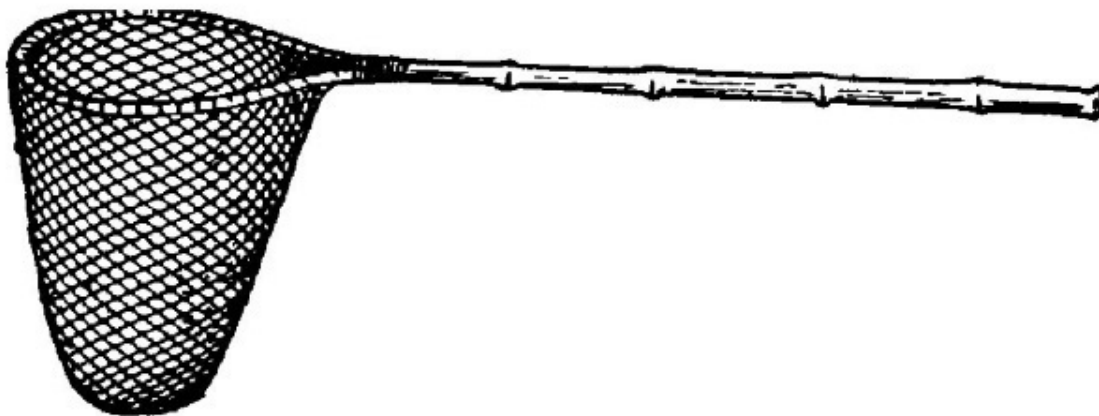
Рис. 2. Подсачек

Подсачек (рис. 2) при ловле в сезон открытой воды должен быть постоянным спутником рыболова. Без него невозможно вытащить крупную рыбу. Подсачек состоит из сетки, обруча и рукоятки. Более удобны сачки, имеющие обруч яйцевидной формы и составную рукоятку. Они портативны при транспортировке и дают возможность подсачивать более крупную рыбу.